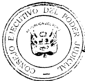
JAVIER VILLA STEIN