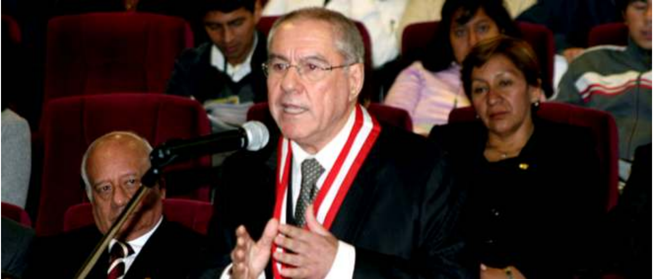
El Presidente del Poder Judicial objetó los artículos 34° y 47° de la cuestionada ley