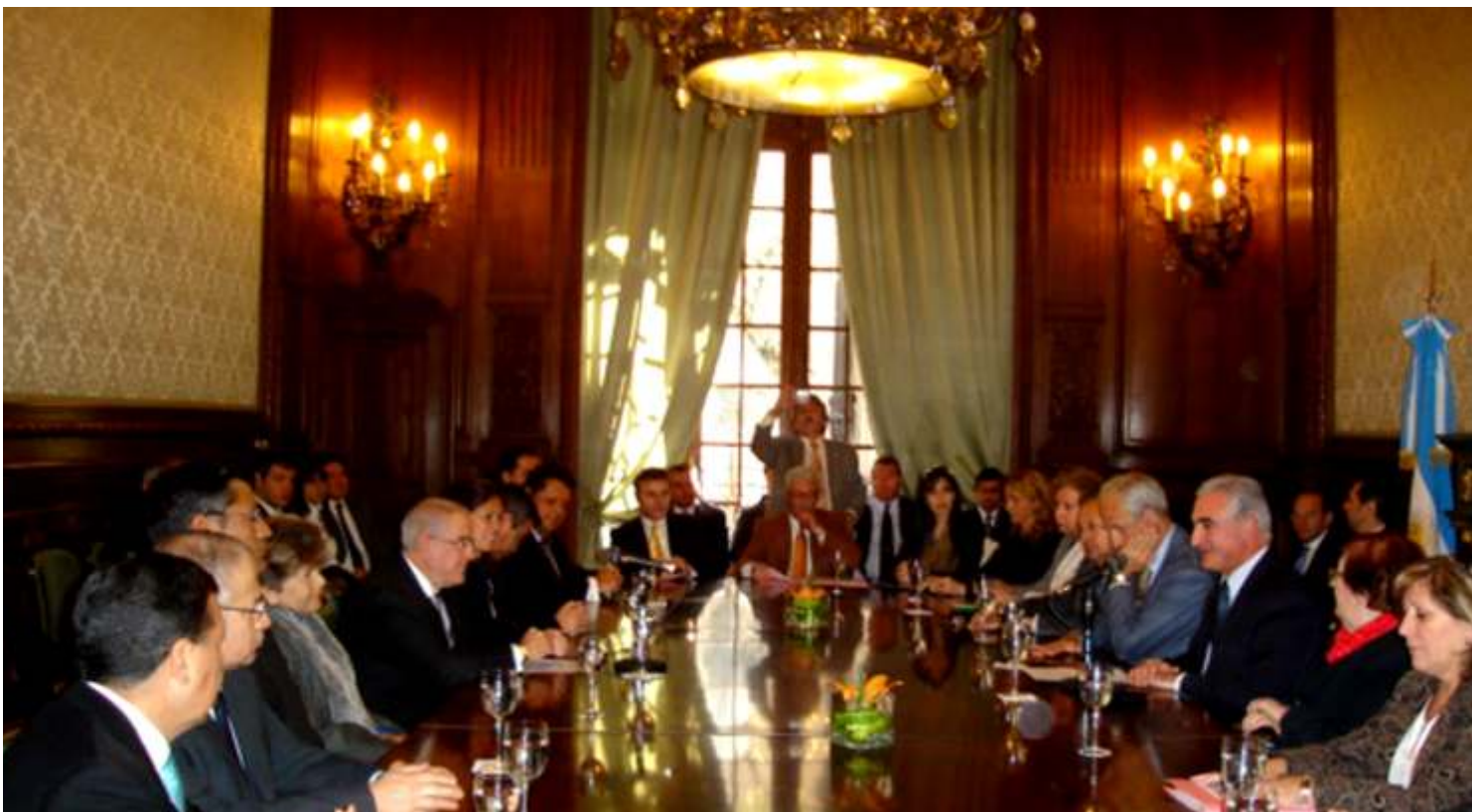
Doctor Javier Villa Stein planteó la creación de equipos de investigación conjunta contra la delincuencia internacional

A nalizar la suscripción de un acuerdo o convenio para la creación de equipos de investigación conjunta, conforme lo establece el artículo 19° de la Convención Internacional contra la Delincuencia Organizada Transnacional, sugirió en Buenos Aires, el Presidente del Poder Judicial, Javier Villa Stein.