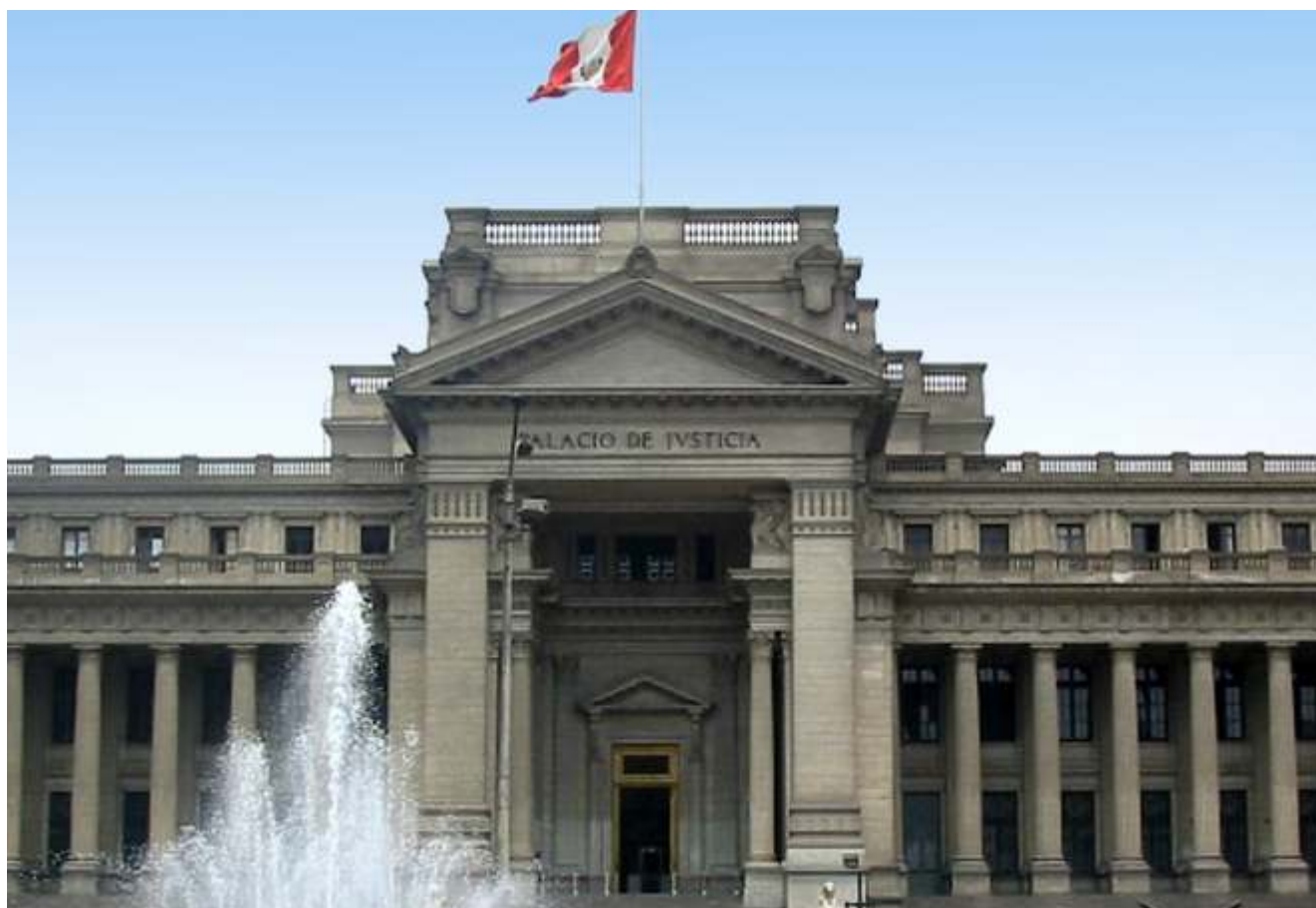
Frontis del Palacio Nacional de Justicia

L os Jueces de Paz Letrado, así como los Jueces Especializados o Mixtos de los Distritos Judiciales del país, atienden a los justiciables o sus abogados, de lunes a viernes de 08:15 a 09:15 horas, en sus respectivas oficinas a puerta abierta, por acuerdo adoptado en forma unánime por el Consejo Ejecutivo del Poder Judicial (CEPJ).