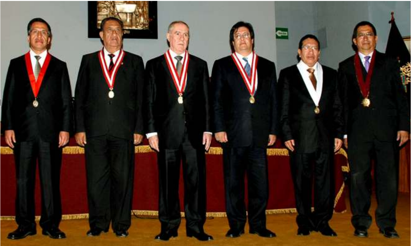
Miembros del Consejo Ejecutivo del Poder Judicial después de jurar a sus cargos el 14 de agosto en Arequipa