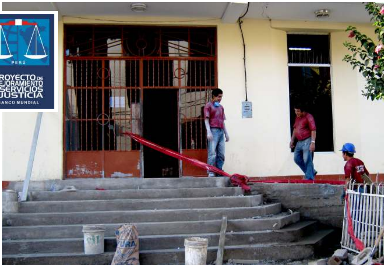
Los trabajos de remodelación incluyeron varias áreas de la sede judicial