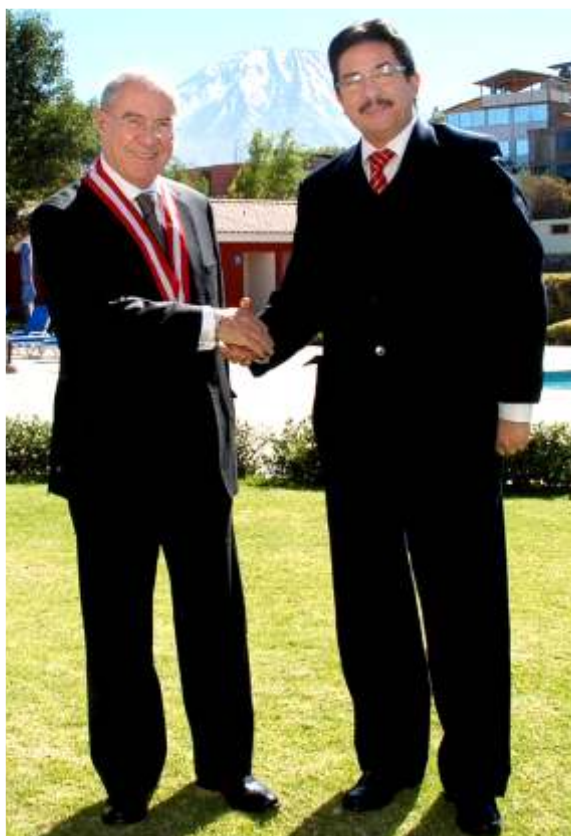
Dr. Javier Villa Stein y Ministro de Transportes, Enrique Cornejo, invitado especial a Segunda Reunión de Presidentes

1.- Reafirmar nuestro compromiso con las políticas institucionales y democráticas impartidas por el doctor Javier Villa Stein, en aras de intensificar el proceso de modernización de la Judicatura Nacional, que implica el rol fundamental del Poder Judicial en el desarrollo y crecimiento económico del país.