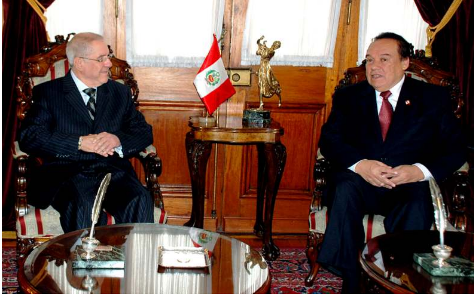
Los Presidentes del Poder Judicial y del Congreso hablan sobre el proyecto de ley