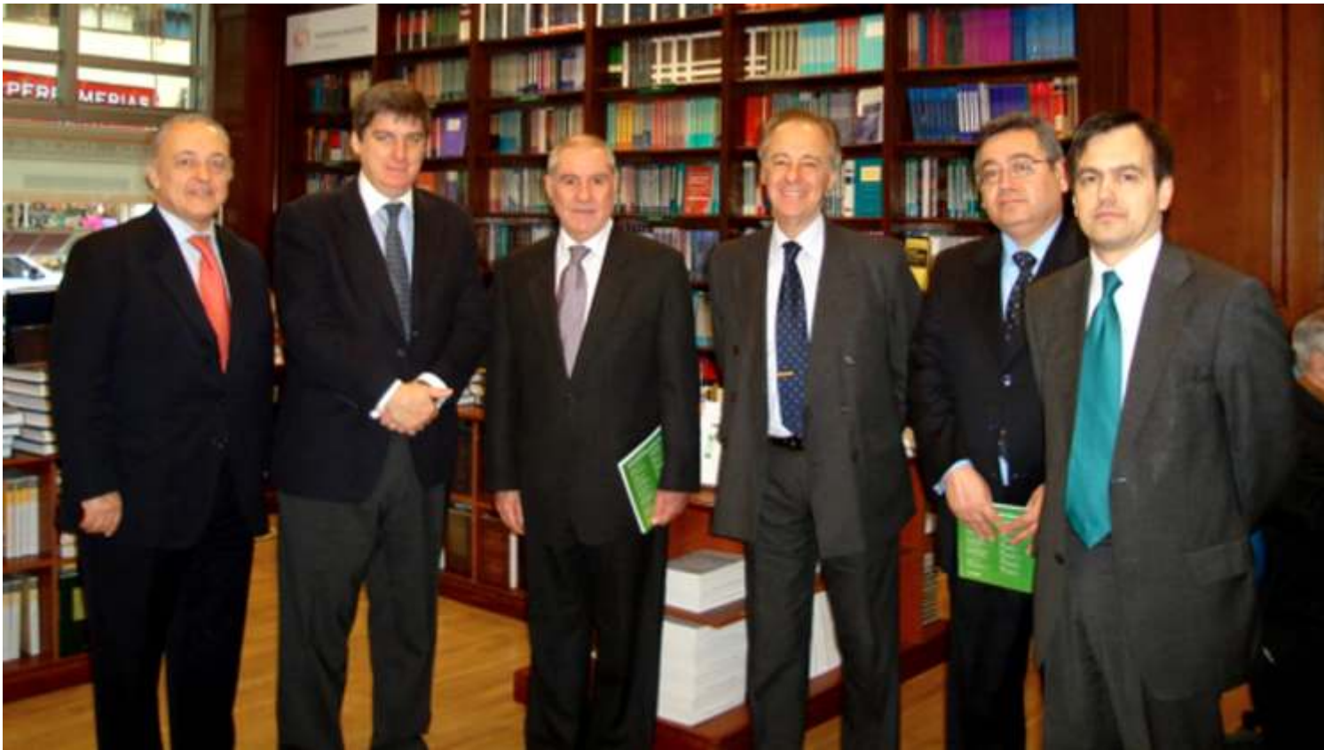
Presidente de la corte Suprema con directivos del diario La Ley en Buenos Aires