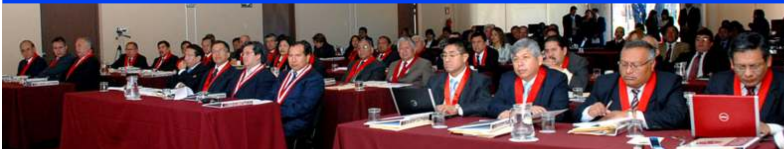
Presidentes de Cortes Superiores durante Segunda Reunión Anual