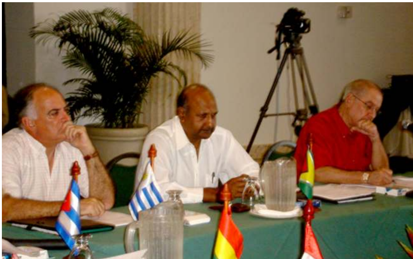
Doctor Javier Villa Stein durante su participación en IV cumbre de UNASUR

D urante la IV Cumbre de Presidentes de Poderes Judiciales de la Unión de Naciones Suramericanas (UNASUR), realizada en Cartagena de Indias, Colombia, el doctor Javier Villa Stein, planteó la revisión del proceso de extradición para hacerlo más rápido, expeditivo y moderno.