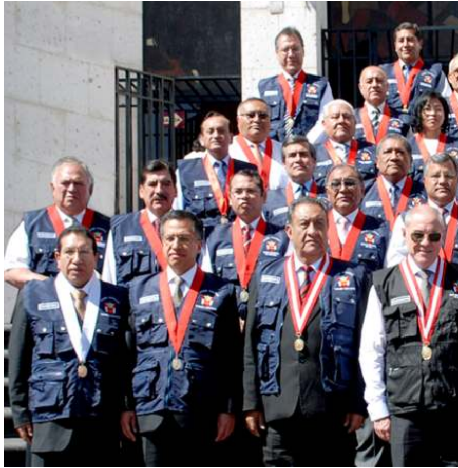
Los Presidentes de las 29 Cortes Superiores acompañados