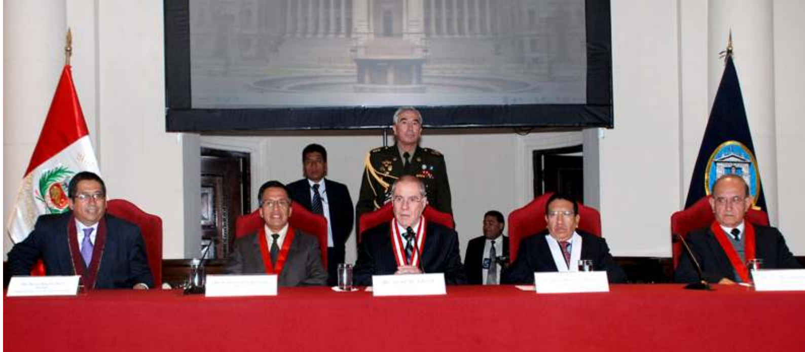
Presidente del Poder Judicial acompañado por miembros del Consejo Ejecutivo del Poder Judicial y Otto Egúsqüiza Roca.