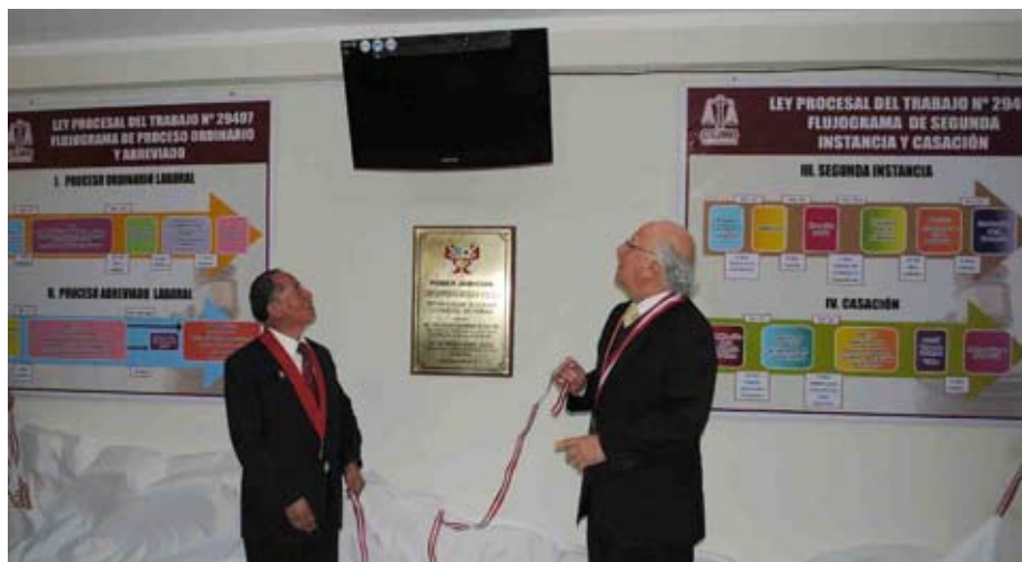
A la fecha la nueva ley procesal del trabajo está vigente en once Distritos Judiciales.

Similares actos se efectuaron en el Distrito Judicial del Santa donde la nueva normativa se aplica desde el 22 de julio y en Cajamarca donde está en vigencia desde el 26 de julio. ■