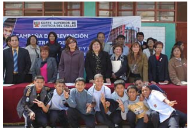
Comisión de Proyección Social de la Corte Superior del Callao realizó charla preventiva de delitos en el colegio Miguel Grau de la Perla.

Los jueces y personal jurisdiccional integrantes de la Comisión de Proyección Social de la Corte Superior del Callao, realizaron una jornada de charlas para los alumnos del colegio Miguel Grau del distrito de La Perla donde brindaron información preventiva sobre delitos que atentan contra el patrimonio, la libertad sexual, así como las consecuencias que desencadenan el aborto, el tráfico ilícito de drogas y el pandillaje pernicioso.