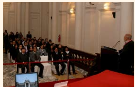
El CEJ estará disponible en todas las Salas de la Corte Suprema.

El doctor Calderón Castillo exhortó al personal encargado del manejo de este servicio actualizar permanentemente la información de cada uno de los registros y así dar un óptimo servicio al usuario. ■