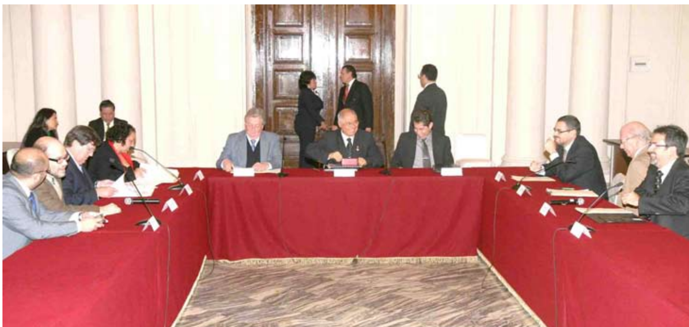
Presidente del Poder Judicial se entrevistó con representantes de la Prensa peruana e IPYS.