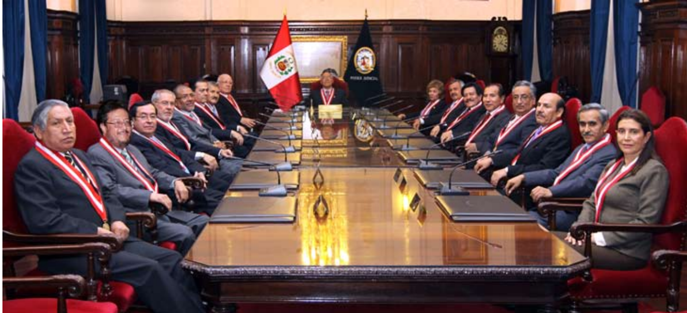
Delegación de facultades permitirá tramitar con rapidez cuatro importantes proyectos de ley.