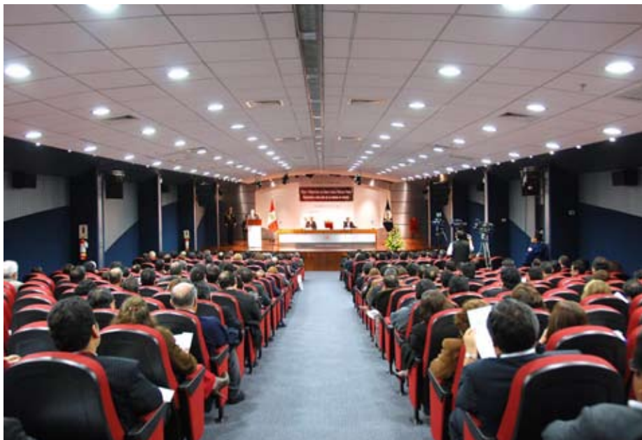
Seminario Internacional por los cinco años de vigencia del Nuevo Código Procesal Penal tuvo gran acogida.

● Un balance efectuado al cumplirse un lustro de la implementación progresiva de este cuerpo normativo revela resultados positivos.