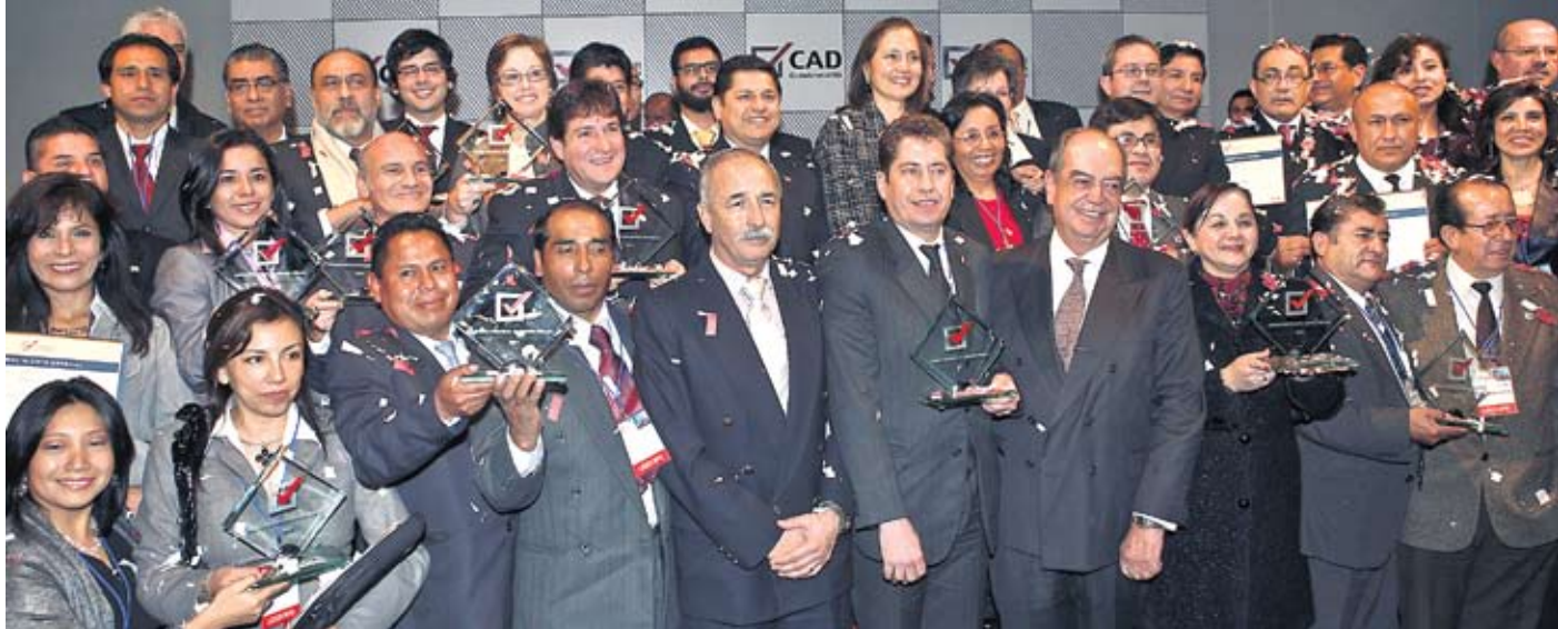
Galardón entregado al Poder Judicial reconoce avances en materia de transparencia y de acceso a la información.