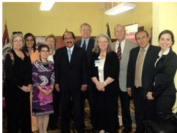
Equipo de especialistas de la Asociación de Paz y Esperanza en atención a víctimas de Violencia Sexual de Estados Unidos.

La cita sirvió para intercambiar trabajos, experiencias y pautas, sobre el mejoramiento y desarrollo de la impartición de justicia en el Distrito Judicial de Huánuco, fundamentalmente en lo relativo al delito de violación de la libertad sexual - casos de abuso sexual infantil - y sobre el nuevo modelo procesal penal.