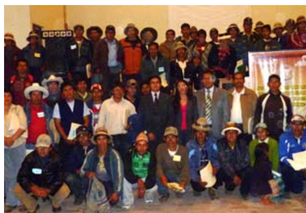
Magistrados y asistentes del Taller de Operadores de Justicia Local de Cotabambas