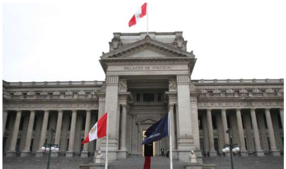
Frontis del Palacio de Justicia.

Del mismo modo, se debe dejar sin efecto la elección en caso de incumplimiento de los requisitos exigidos en la Ley N° 28545, a que se refieren los artículos 34°, 35° y 36° del Reglamento de Elección de Jueces de Paz, aprobado por el CEPJ en el año 2006. ■