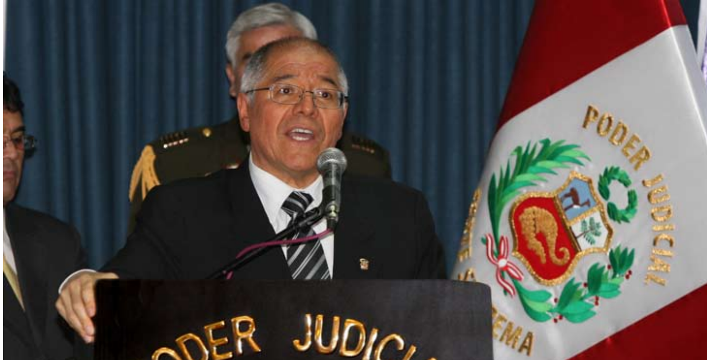
Presidente del Poder Judicial, Doctor César San Martín Castro.