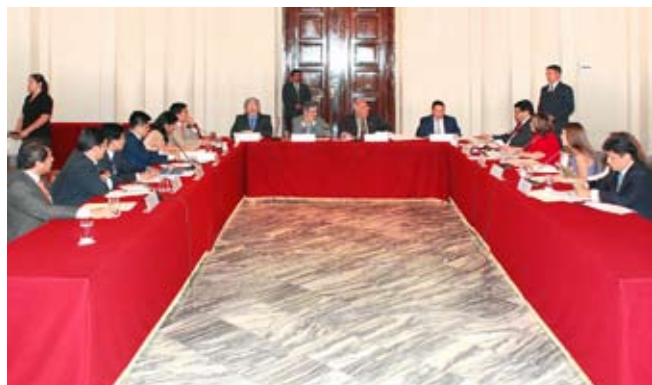
En la reunión se plantearon iniciativas para corregir las debilidades que se presentaron en los primeros 30 días del NCPP.