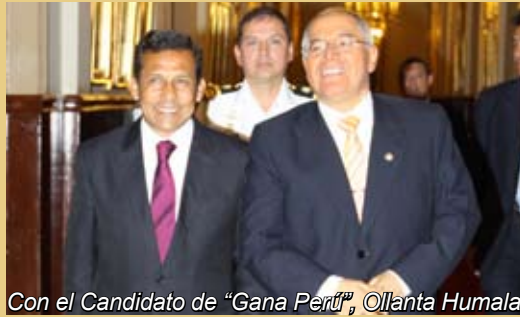
Con el Candidato de “Gana Perú”, Ollanta Humala.

Destacó el compromiso de los candidatos de respeto a la institucionalidad democrática, sobre todo en lo referido al sistema de justicia.