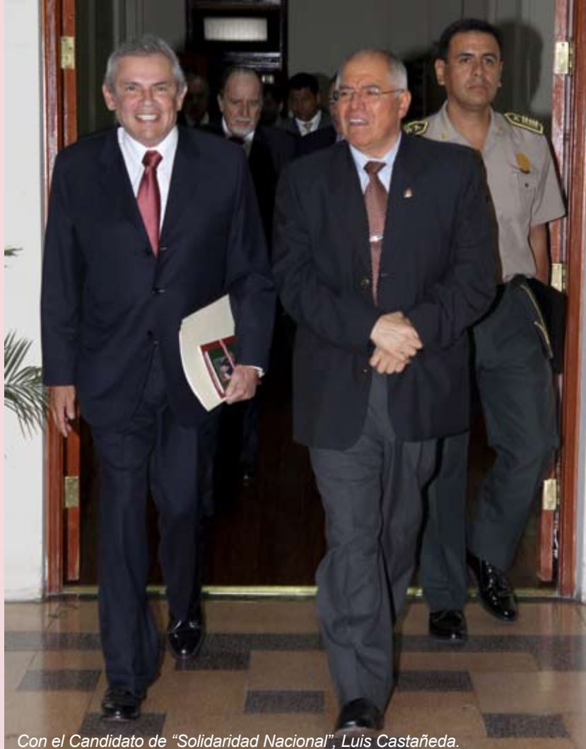
Con el Candidato de “Solidaridad Nacional”, Luis Castañeda.

Propuso que además de los juicios por alimentos y procesos constitucionales, también debieran ser gratuitos los procesos sobre violencia familiar, contra la mujer; violaciones de derechos humanos; e incluso las causas de menor cuantía para los sectores de la sociedad que no cuenten con recursos para solventar su actuación procesal.