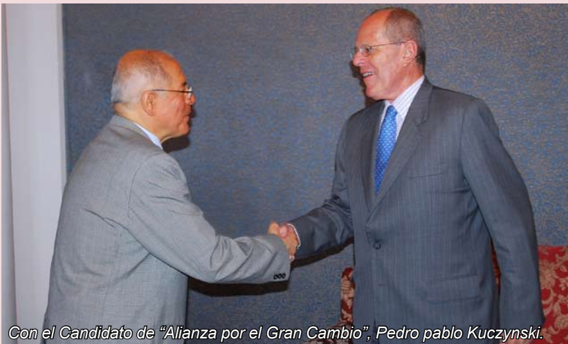
Con el Candidato de “Alianza por el Gran Cambio”, Pedro pablo Kuczynski.