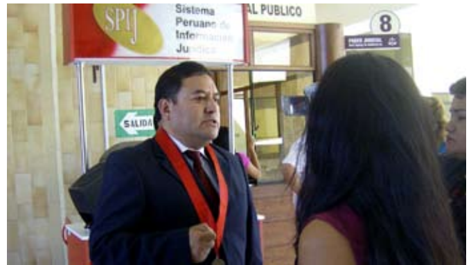
Presidente de la Corte Superior de Ica, doctor Bonifacio Meneses Gonzáles inaugurando el primer sistema de colas y turnos del Centro de Distribución General (CDG).

“Este nuevo sistema dará una imagen de modernidad y confort al usuario y trabajador, un excelente medio de ordenamiento para el caos en las colas de espera, un eficaz medio de comunicación hacia el usuario y entre operadores, y un completo reporte estadístico de gestión en línea y por rango de fechas”, señaló el doctor Bonifacio Meneses Gónzales, Presidente de la Corte Superior de Justicia de Ica.