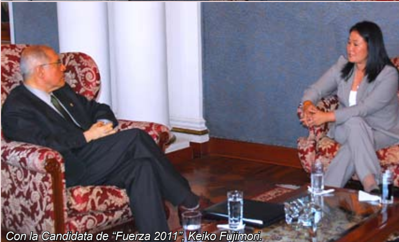
Con la Candidata de “Fuerza 2011”, Keiko Fujimori.

pecializada para acelerar las controversias entre particulares y el Estado, las mismas que actualmente son lentas.