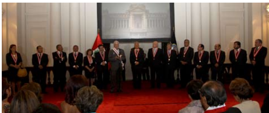
Mario Vargas Llosa y miembros de la Sala Plena de la Corte Suprema.

“Es un ejemplo y un símbolo de lo que todos los peruanos democráticos, honrados y decentes quisiéramos tener en todos los tribunales”, refirió. ■