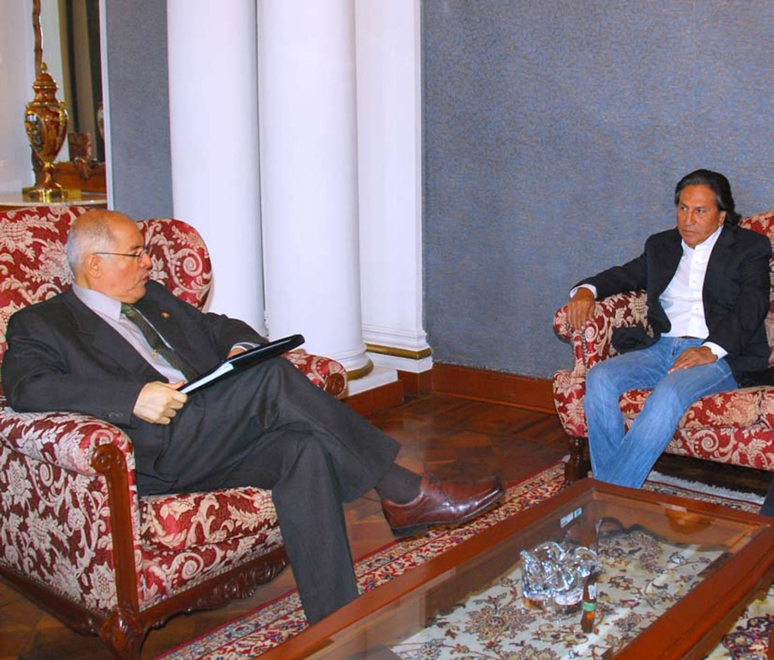
Presidente del Poder Judicial, César San Martín y el candidato de "Perú Posible" Alejandro Toledo.