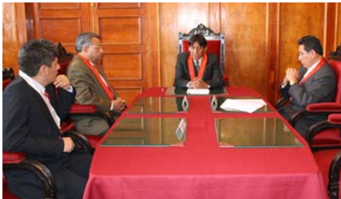
Primera sesión del Consejo Ejecutivo Distrital con sus nuevos integrantes.

Los integrantes del Consejo Ejecutivo Distrital de la Corte Superior del Cusco juramentaron a sus cargos en una ceremonia especial.