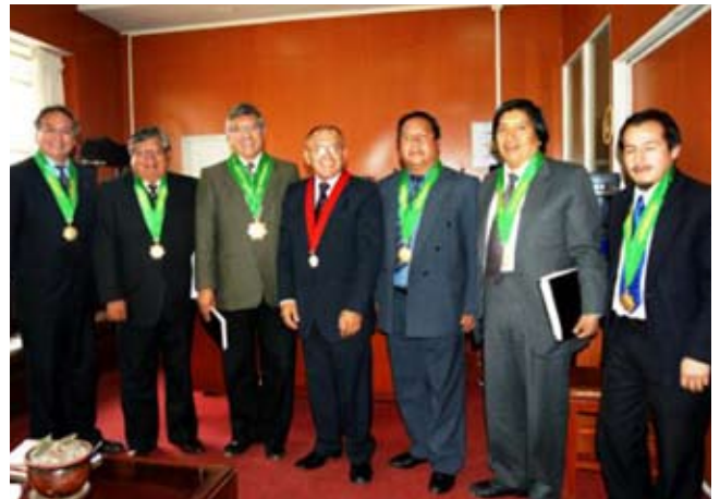
El Presidente de la Corte Superior de Justicia de Junín, Dr. Alcibiades Pimentel Zegarra acompañado por la directiva del Colegio de Abogados.

“Es saludable este tipo de reuniones orientadas a solucionar los impases que se puedan presentar y de esa forma mejorar el sistema de justicia en el Distrito Judicial de Junín; existe el compromiso de trabajar unidos en las diferentes actividades académicas y otros; asimismo adoptaremos las medidas correctivas frente a los posibles problemas”, expresó el Dr. Alcibiades Pimentel Zegarra.