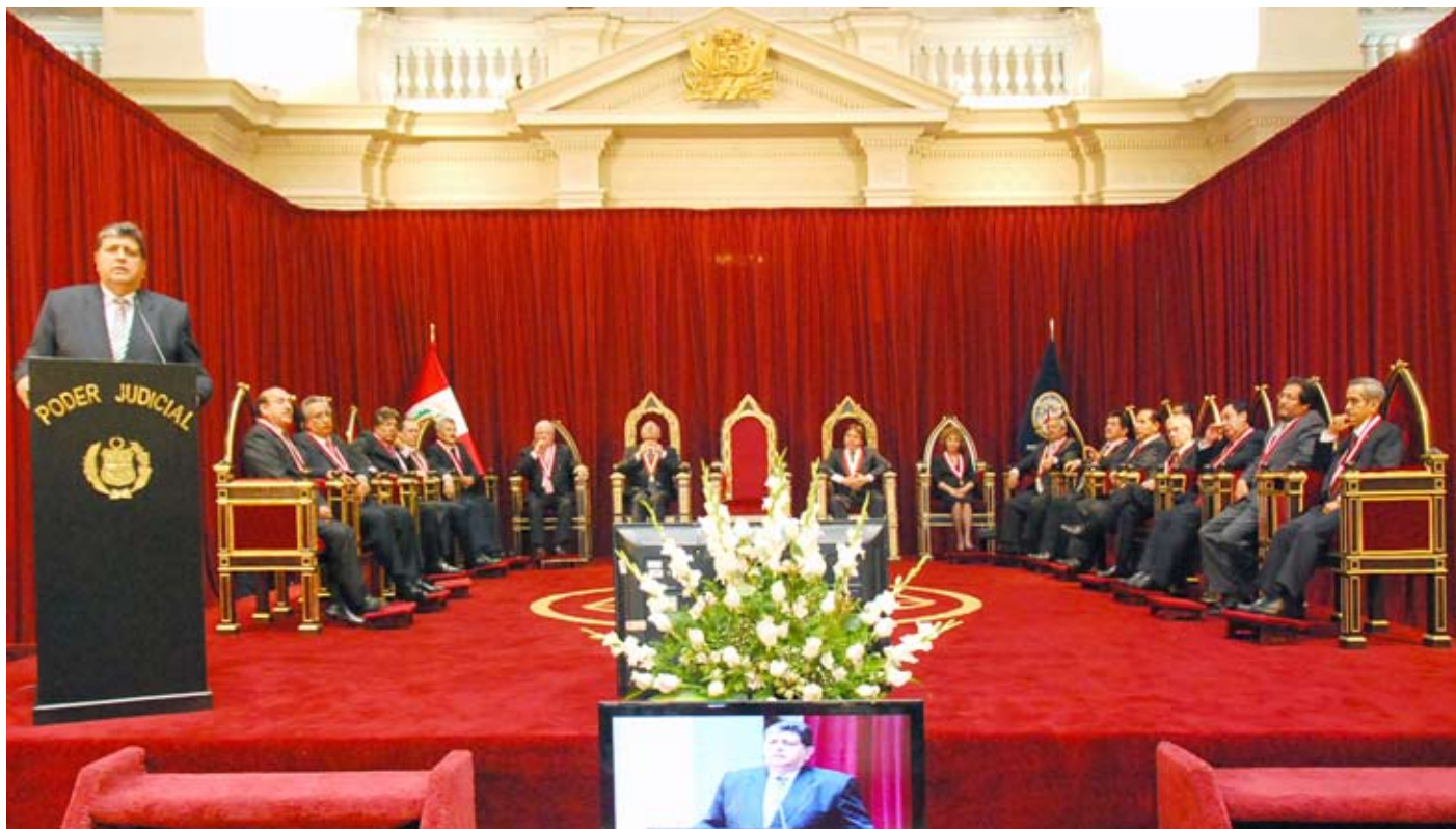
Presidente de la República destacó logros en el Poder Judicial.

Jefe de Estado pide a población apoyar esfuerzos de autoridades judiciales.