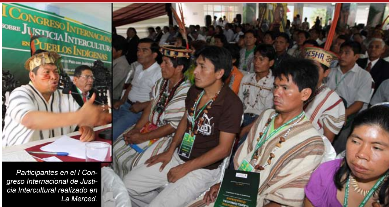
Participantes en el I Congreso Internacional de Justicia Intercultural realizado en La Merced.