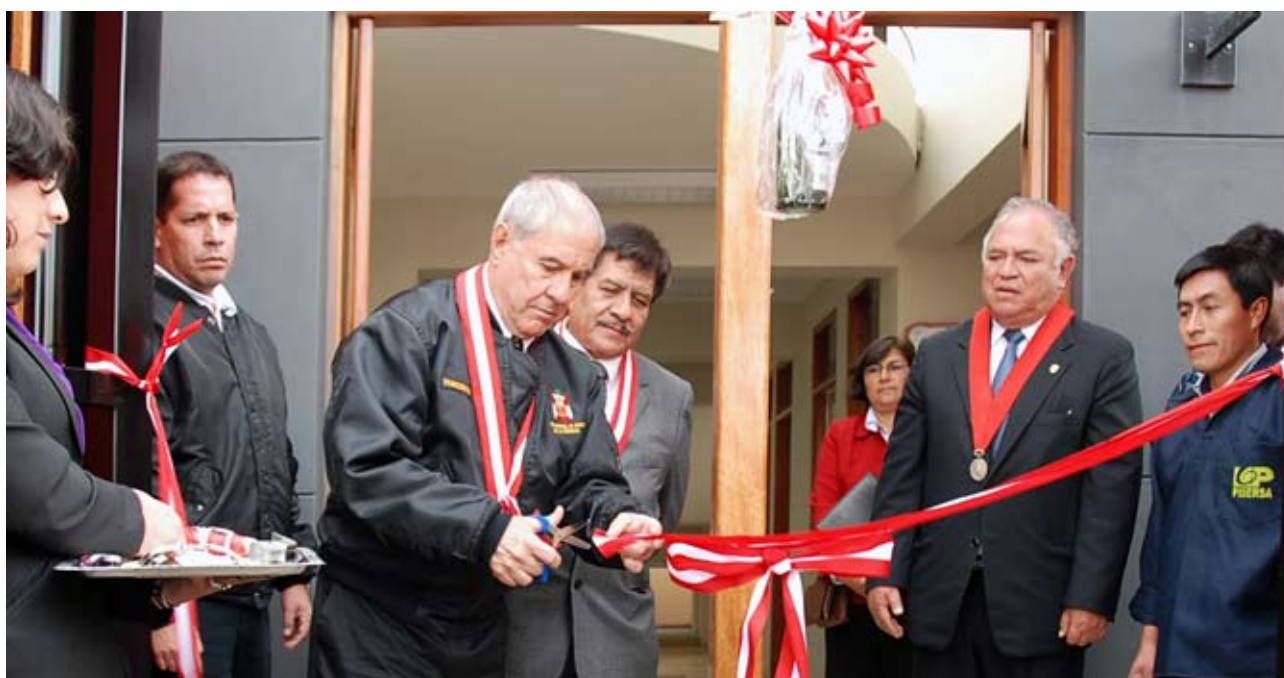
Presidente del Poder Judicial corta cinta en Modulo Basico de Justicia de Baños del Inca

Manifestó que en este periodo se construyó infraestructura y se entregó vehículos a los Distritos Judiciales del país, y “se tecnicizó el Poder Judicial desde los pueblos más remotos hasta los más próximos a la capital Lima”.