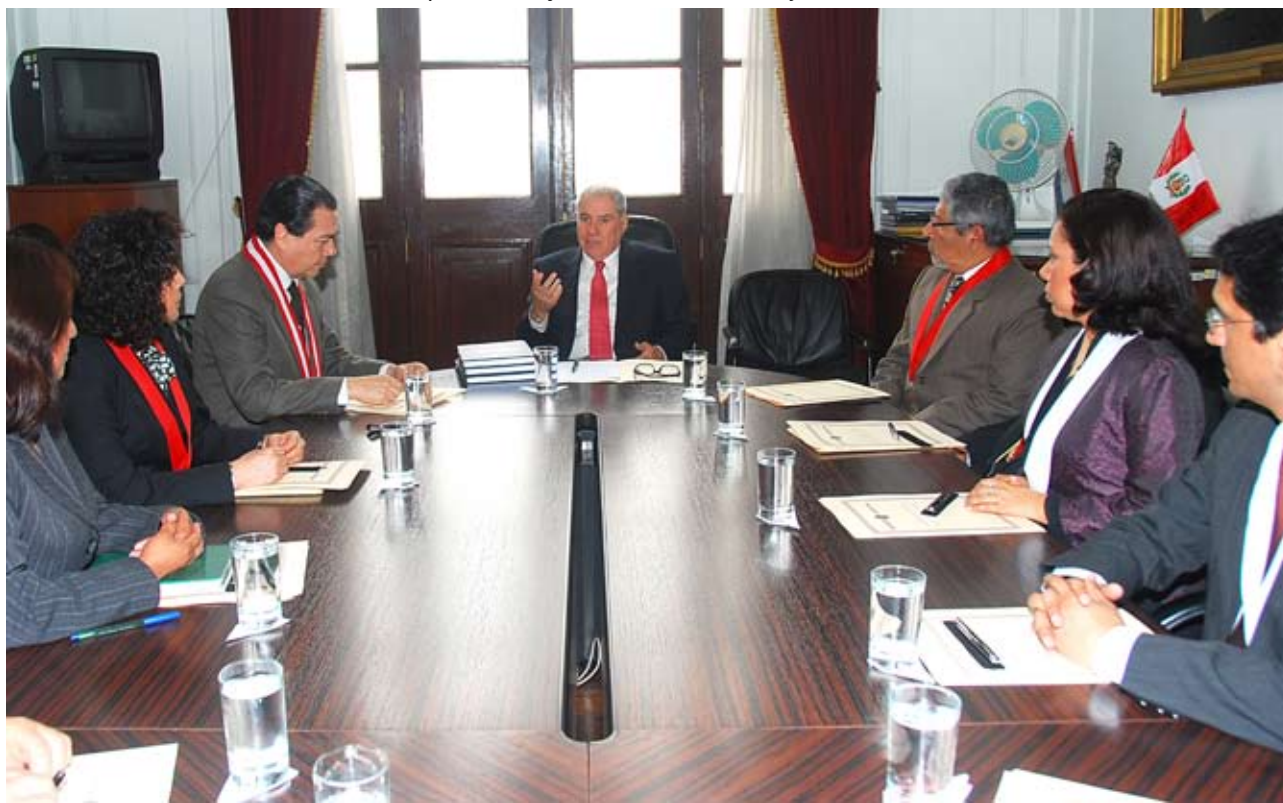
Grupo de trabajo inició labores en mayo de 2009

Adelantó asimismo, que en una próxima sesión del Consejo Ejecutivo del Poder Judicial (CEPJ), máximo órgano de gobierno, propondrá la creación de una Secretaría Técnica, que se encargue de efectuar el control y monitoreo correspondiente de los mandatos de la referida directiva.