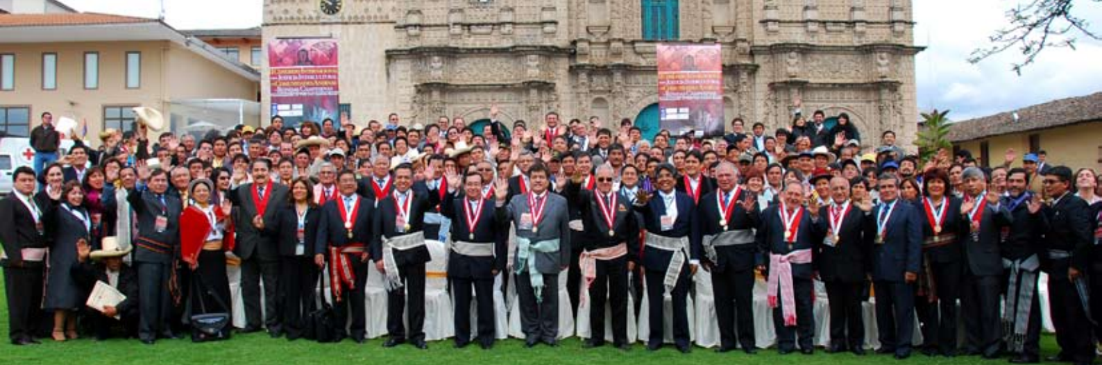
Foto Oficial del II Congreso Internacional sobre Justicia Intercultural realizado en Cajamarca

Durante II Congreso realizado en Cajamarca del 8 al 10 de diciembre