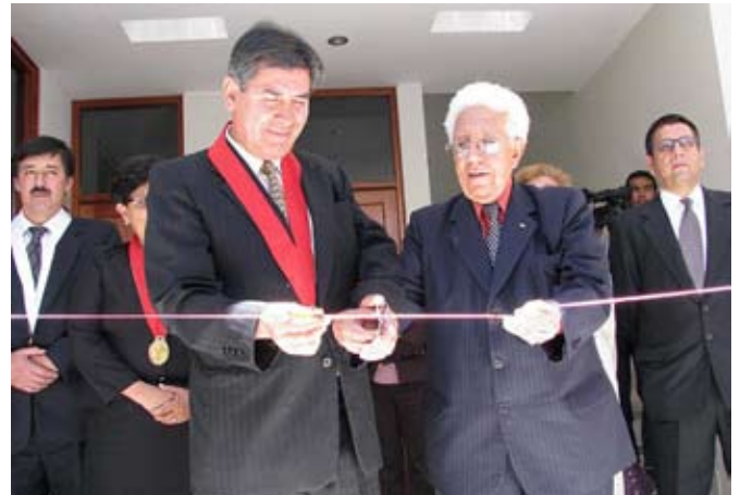
El presidente de la Corte Superior y el alcalde provincial cortan la cinta de acceso a los nuevos ambientes

La ceremonia de inauguración de las obras, se desarrolló el 2 de noviembre en presencia de las principales autoridades de la Corte de Arequipa y de la Municipalidad Provincial, magistrados y personal de esa sede judicial.