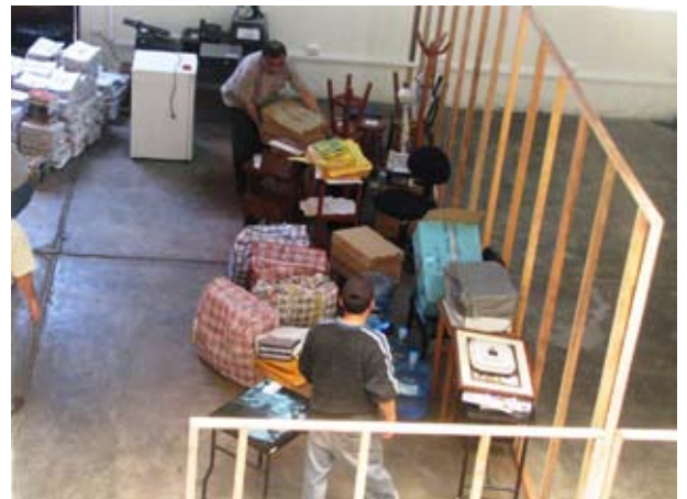
Personal de Lima Norte se trasladó a otro local