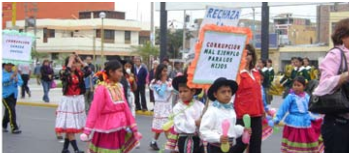
Escolares desfilan con pancartas contra la corrupción en Chimbote

En el marco de su programa de actividades, la mesa de trabajo de la Odecma Santa organizó un pasacalle contra la corrupción judicial por las principales avenidas de Chimbote. Participaron las principales organizaciones e instituciones educativas de la ciudad.