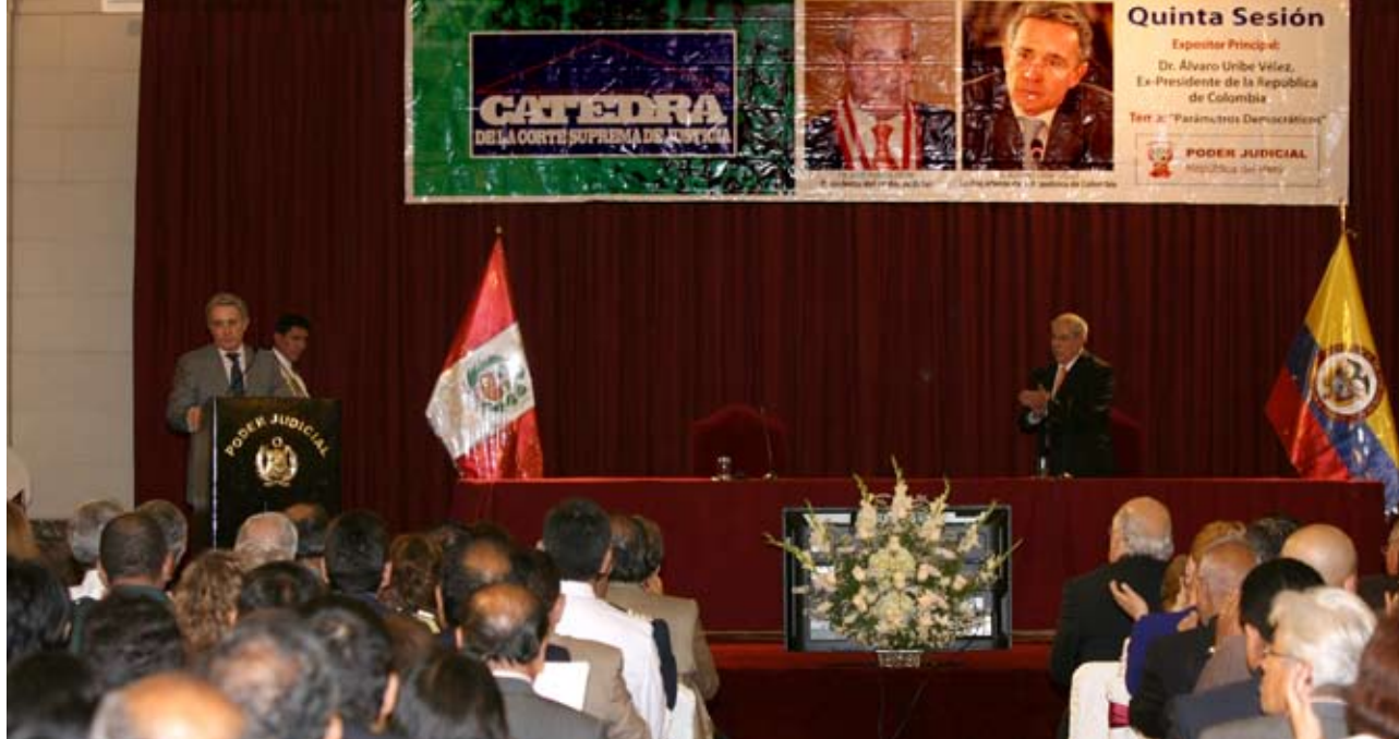
Disertación de ex presidente Colombiano colmó las expectativas de auditorio