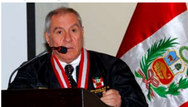
Doctor Javier Villa Stein, presidente del Poder Judicial

“Qué habría sido de la lucha contra ese sendero equivocado, que nos causó tanto daño, si las rondas campesinas no hubieran enfrentado con entereza lo que hicieron, y que nosotros debemos agradecer permanentemente”, subrayó.