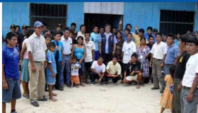
Pobladores de Yutupis reclamaron juzgado permanente

La comunidad nativa ha cedido a la Corte de Amazonas un local para el funcionamiento del juzgado.