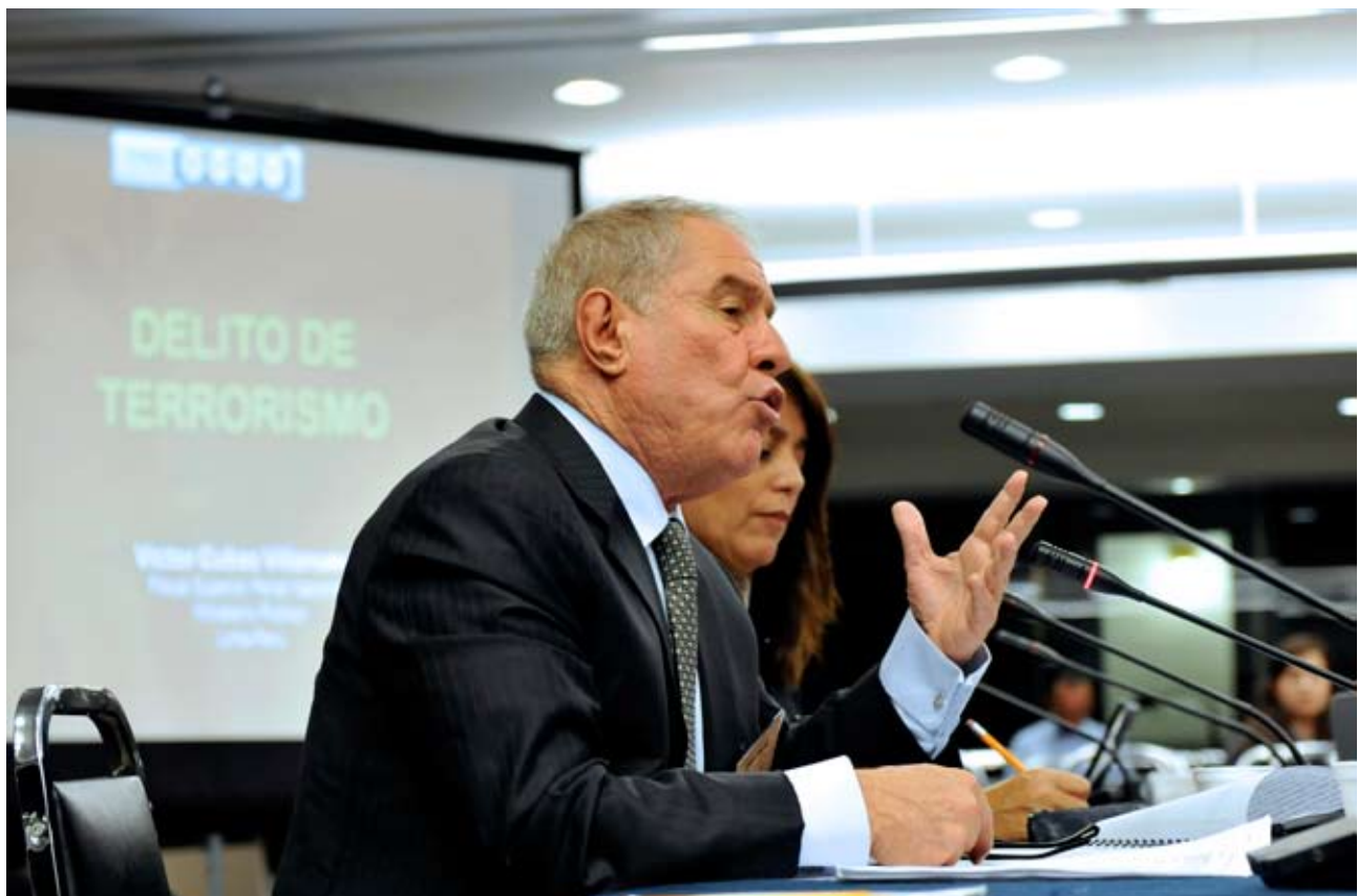
La CIDH realizó su 140º periodo de sesiones en Washington.