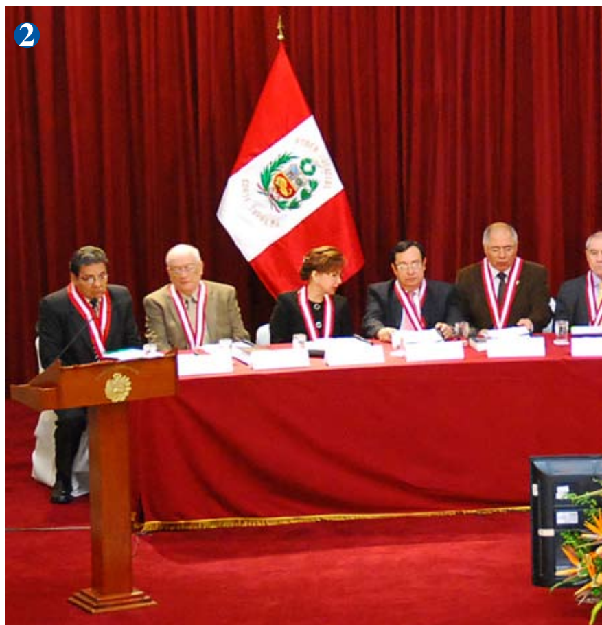
Inauguración de VI Pleno Penal