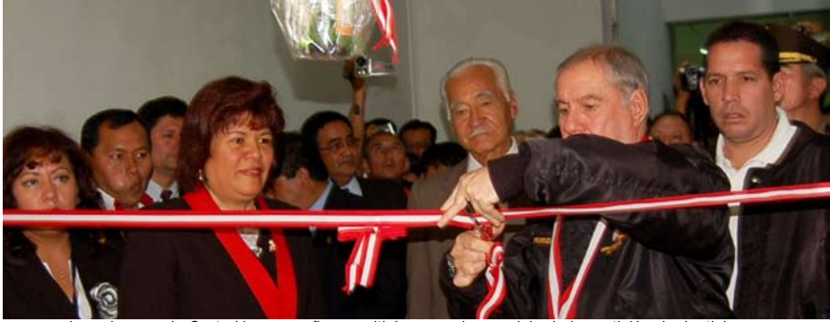
Las obras en la Corte Huanuqueña permitirán un mejor servicio de impartición de Justicia

Jueces deben actuar con la verdad en la mano