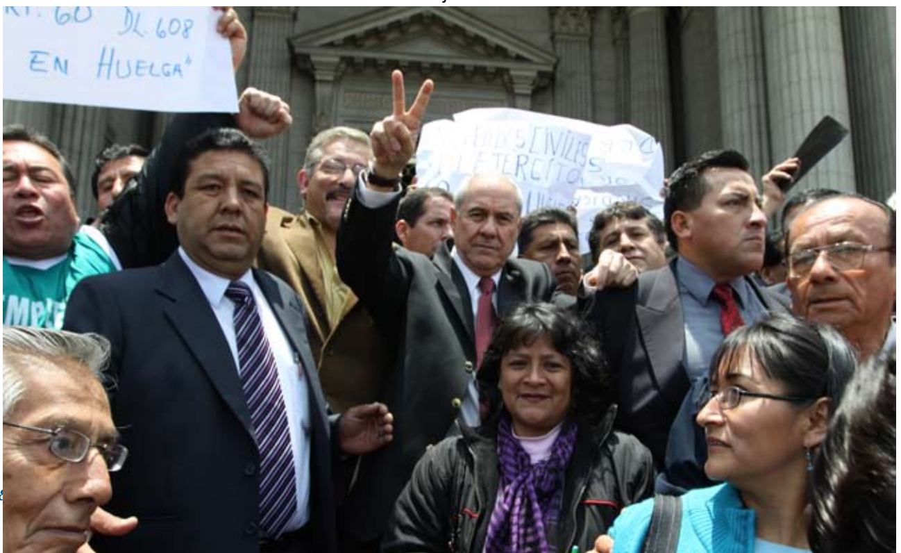
La convocatoria de trabajadores fue multitudinaria.