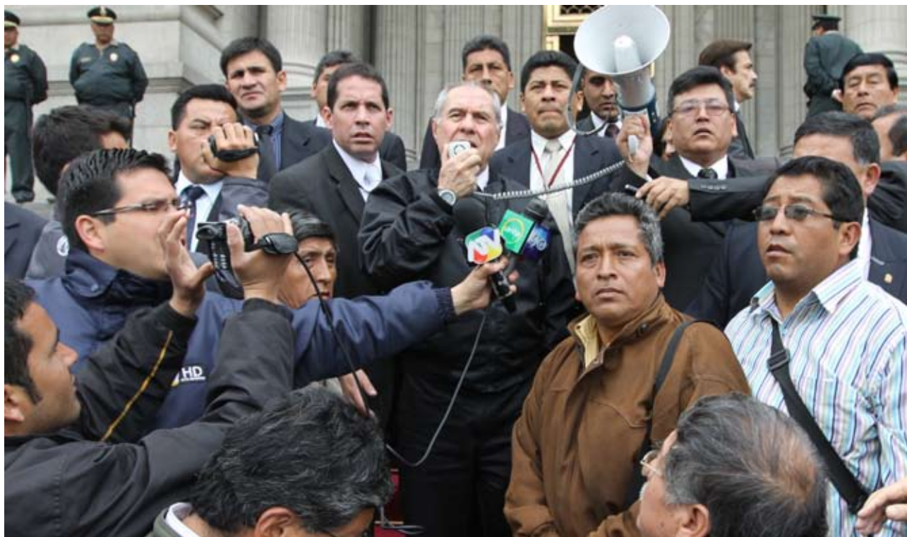
Presidente del PJ respaldó demandas de empleados civiles de las FF.AA.

E l Presidente del Poder Judicial, doctor Javier Villa Stein, exigió al Gobierno, en una demostración pública el 13 de octubre, que cumpla una sentencia judicial que favorece a empleados civiles y pensionistas de las Fuerzas Armadas, que homologa sus remuneraciones con las del personal militar.