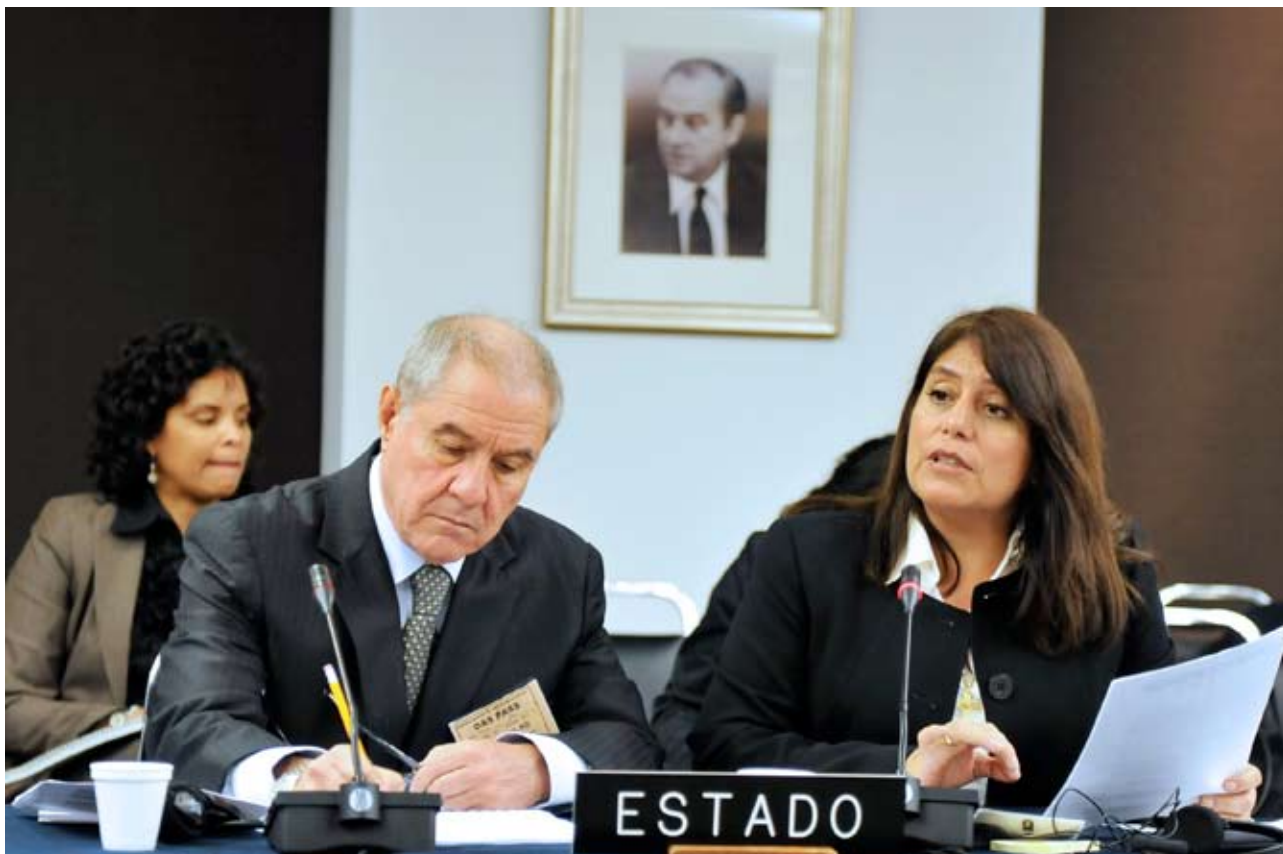
Presidente del Poder Judicial también se refirió al juzgamiento de personas acusadas de terrorismo