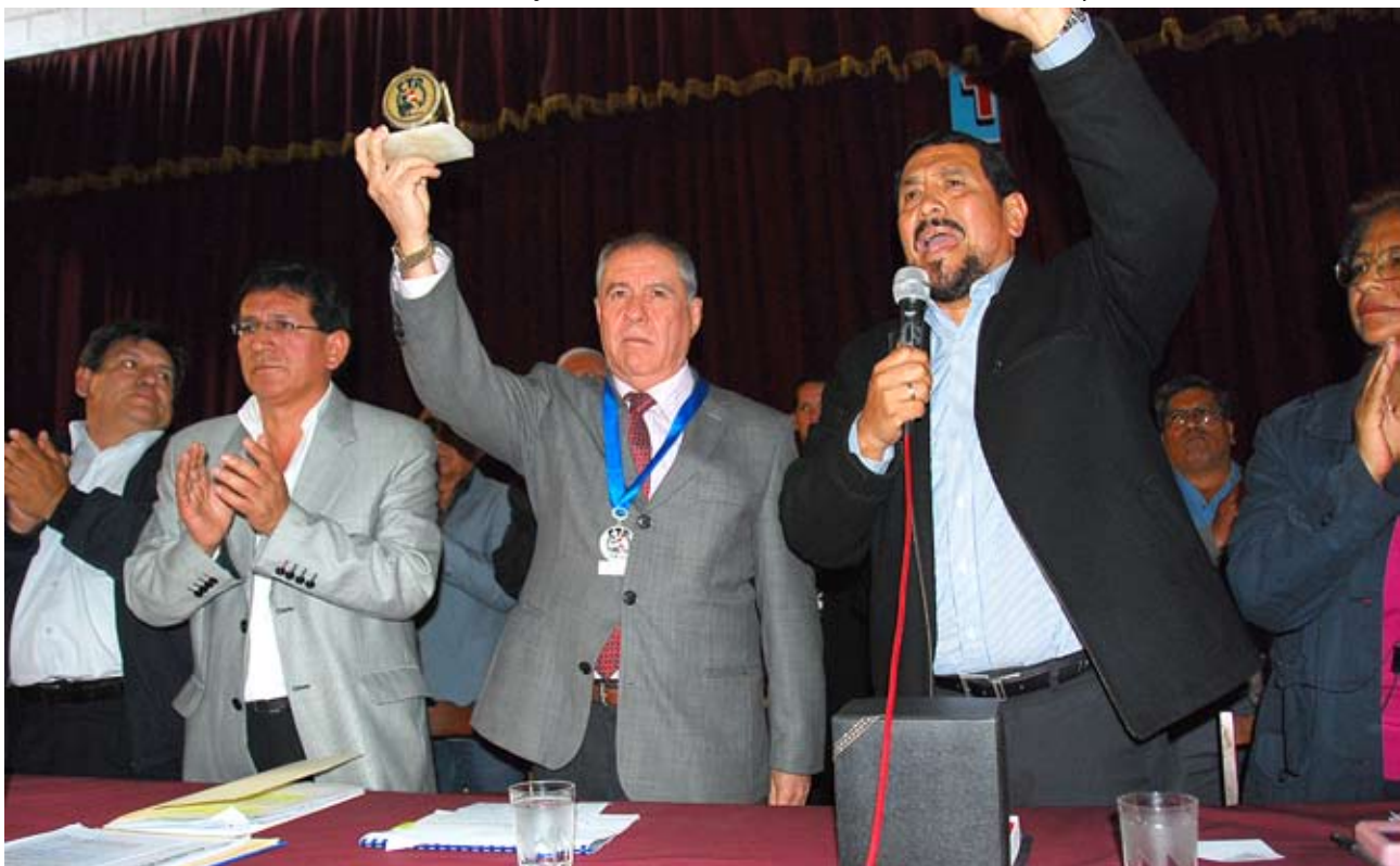
Villa Stein exhortó a los jueces resolver casos en materia laboral con rapidez

Al final de la ceremonia, el doctor Villa Stein también apadrinó la inauguración de la sala “Arturo Sabroso Montoya”, ubicado en la misma sede principal de la organización gremial.