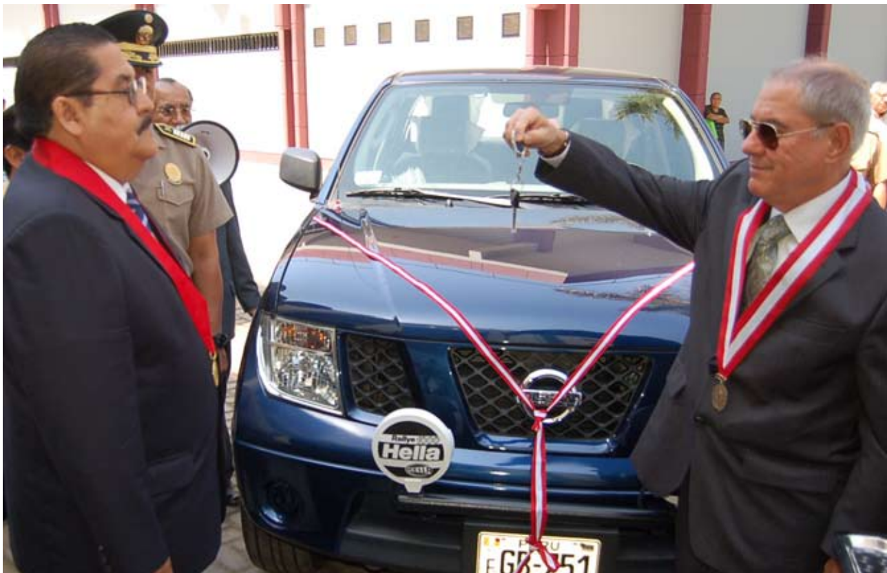
Presidente del PJ entregó moderna camioneta a Corte de Lambayeque

El curso estuvo dirigido a Jueces de todos los niveles competentes en materia laboral y personal jurisdiccional de la Corte Superior del Cusco. Se inició el sábado 23 de octubre en el Palacio de Justicia del Cusco con la capacitación al personal de informática, y culminó el miércoles 27.