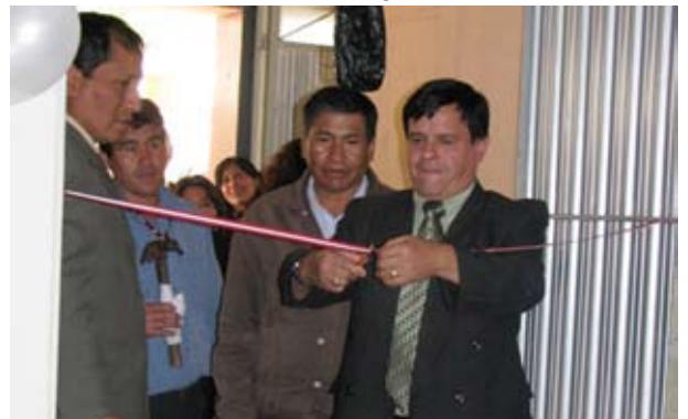
El Presidente (e) de la Corte de Apurímac, el Juez de Chincheros y el Alcalde Provincial inauguran ambientes

A su turno, el alcalde destacó que cuando se debatió en el Concejo la habilitación de los ambientes, el pedido fue aprobado por unanimidad, en una demostración de buena voluntad de autoridades y pueblo de Chincheros en colaborar con la justicia.