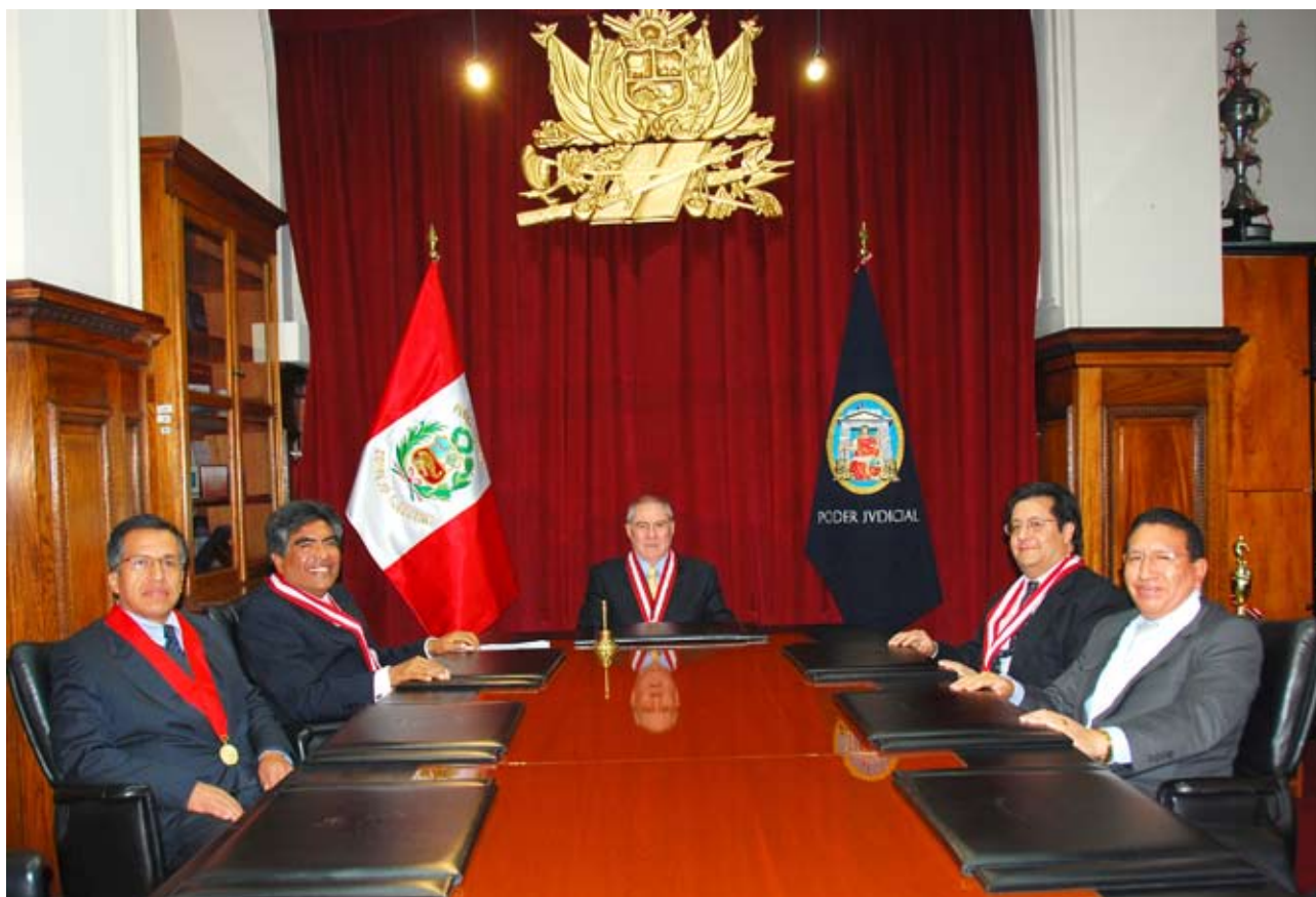
Doctor Javier Villa Stein y miembros del Consejo Ejecutivo del Poder Judicial.