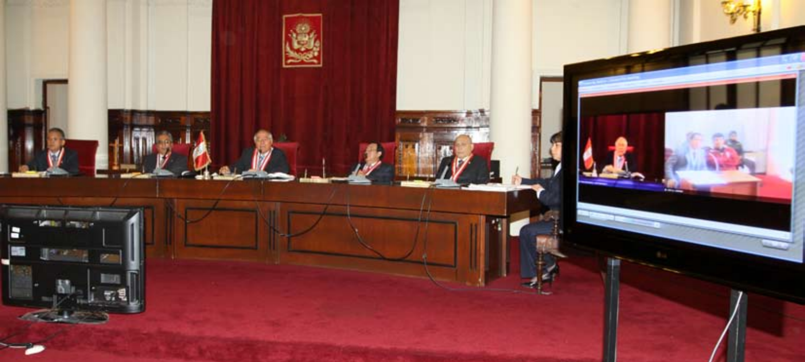
Los miembros de la Sala en Lima se conectaron con el reo y su defensor en Trujillo