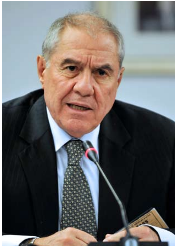
Dr. Javier Villa Stein

Por la tarde, Villa Stein expuso ante los comisionados sobre estándares internacionales y juzgamiento de personas acusadas de terrorismo en el Perú, en la que hizo una comparación entre la legislación nacional con la internacional.