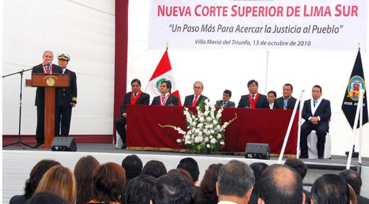
La nueva Corte de Lima Sur atenderá cerca de dos millones de habitantes