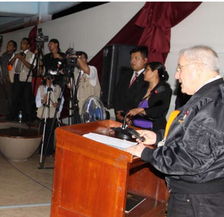
2 Participaron magistrados de 11 Cortes Superiores