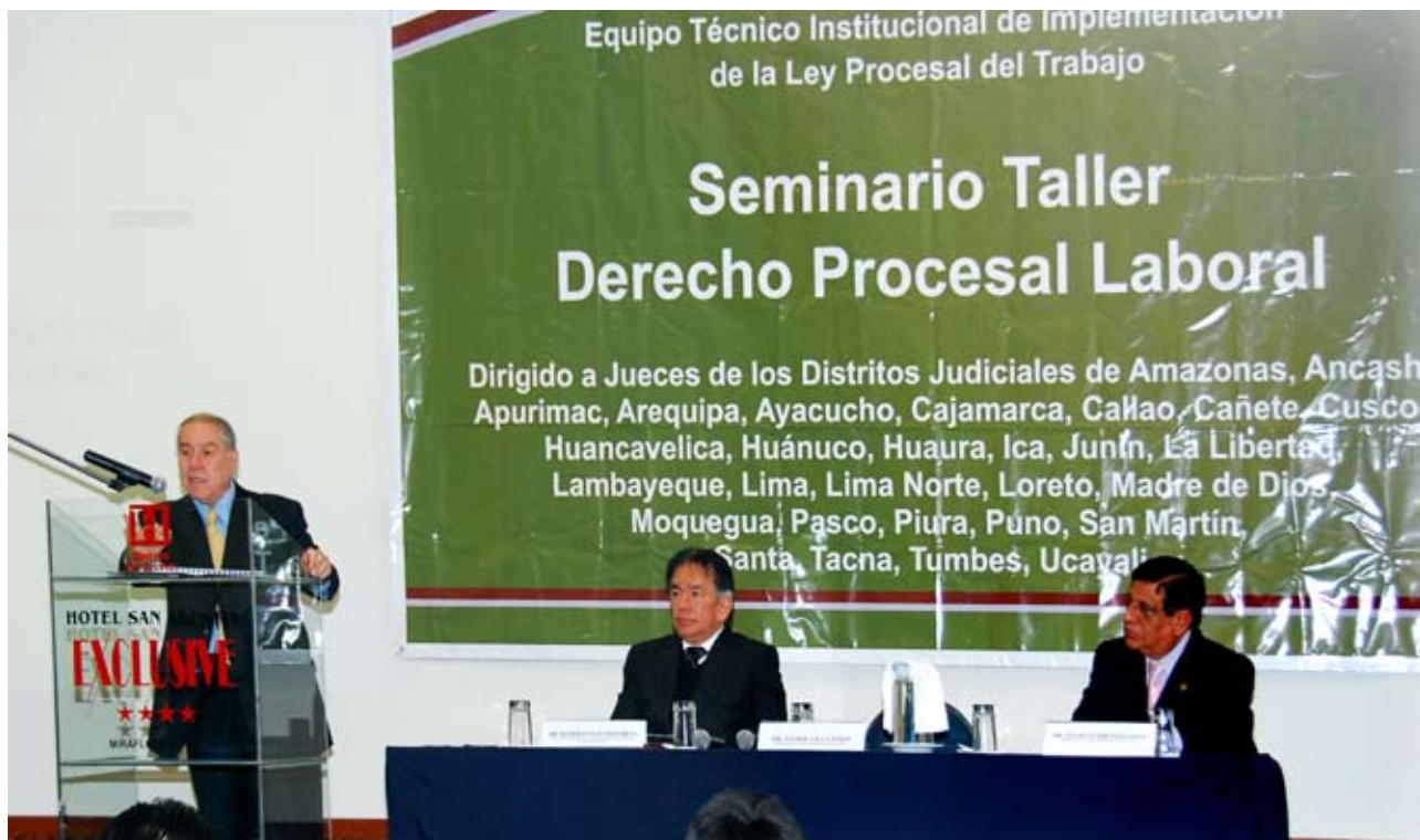
Presidente del Poder Judicial, Javier Villa Stein inauguró Taller de Derecho Procesal Laboral

Una exhortación a todos los magistrados del Perú, para que cambien su cultura procesal, para dar una más rápida solución a los conflictos que tienen a su cargo, formuló el Presidente del Poder Judicial, doctor Javier Villa Stein, el 8 de setiembre último.