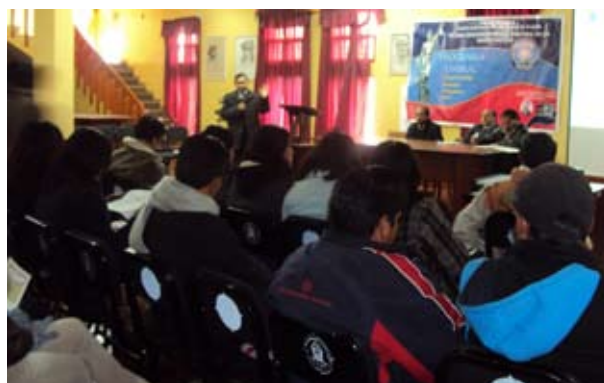
Estudiantes de Derecho concurrieron masivamente al seminario