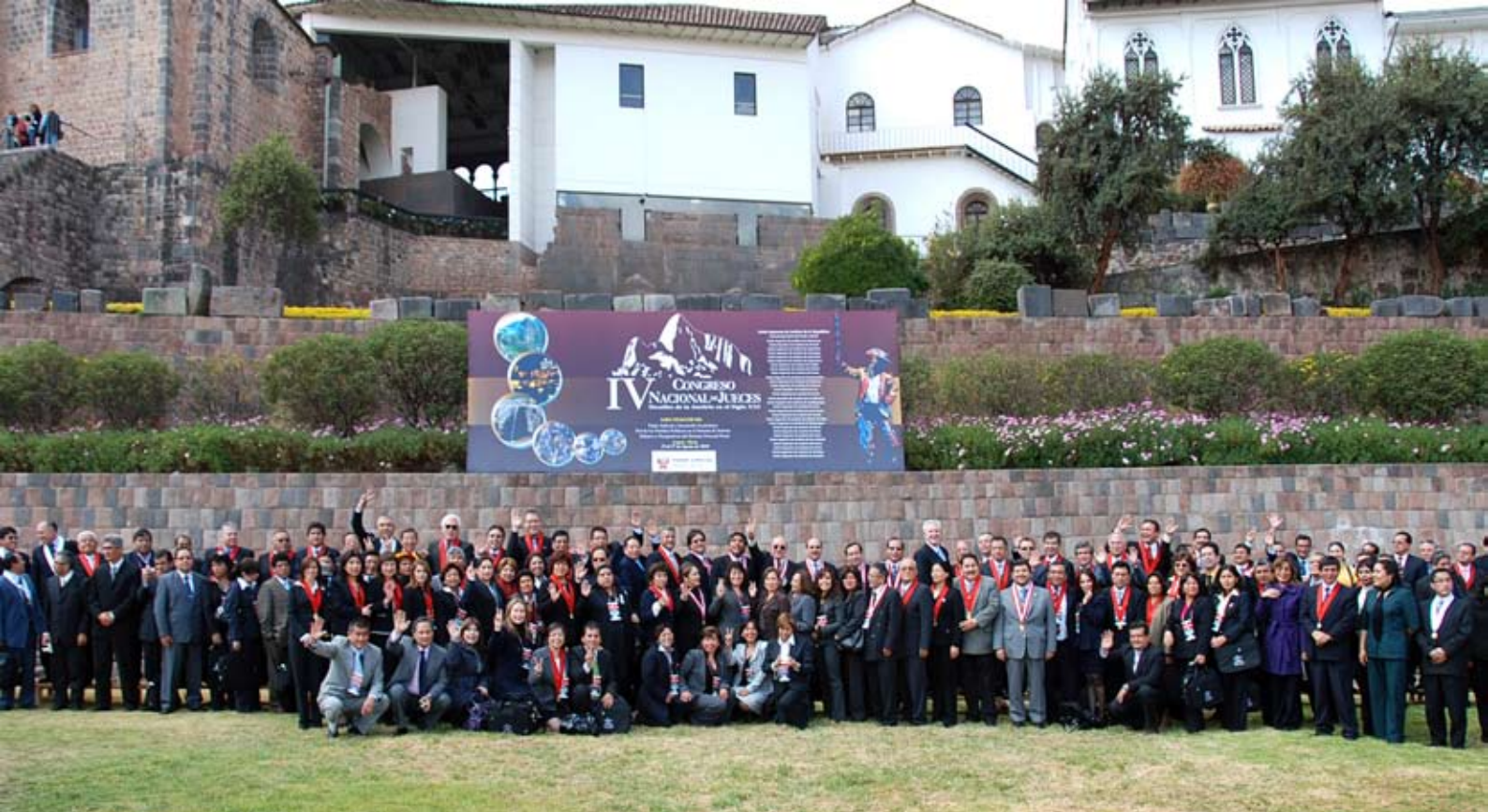
Foto oficial del IV Congreso Nacional de Jueces realizado en el Cusco del 25 al 27 de Agosto.