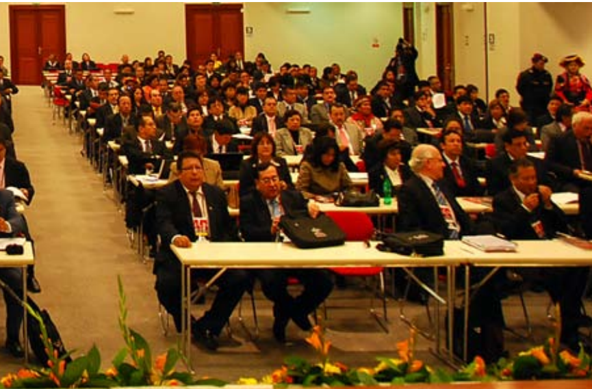
el Poder Judicial, stein.