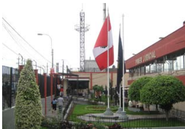
Un servicio telefónico integrado favorece la comunicación inmediata en la sede judicial.

El distrito Judicial de Lima Norte puso al servicio de los usuarios de justicia un servicio telefónico integrado, con el cual, los magistrados, el personal y el público podrán comunicarse en ese sector con solo marcar los anexos existentes.