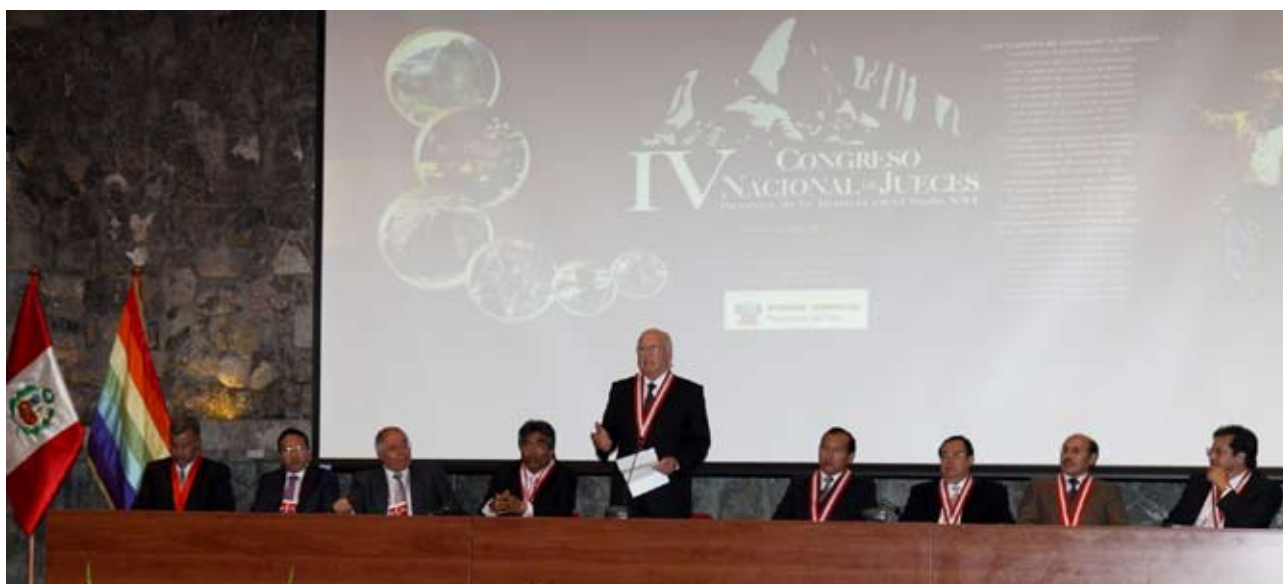
Juez Supremo Decano, Luis F. Almenara, clausura IV Congreso Nacional de Jueces.

En Declaración del Cusco, magistrados de todo el país, expresan preocupación por decisión del Ejecutivo de suspender implementación del nuevo Código Procesal Penal en Lima y otros Distritos Judiciales