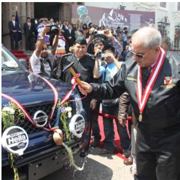
Presidente del PJ entrega una de las cinco camionetas en ceremonia en Corte Superior del Cusco.