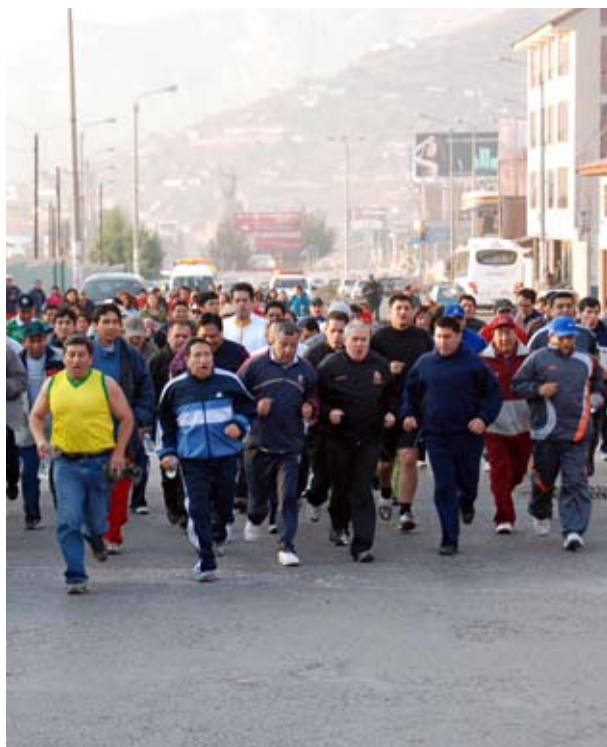
Magistrados participaron activamente en caminata por calles cusqueñas.

También se procedió a la conversión del Juzgado de Trabajo Transitorio en Tercer Juzgado de Trabajo del Cusco y, finalmente, la del Juzgado Penal Liquidador Transitorio de Santiago, en el Quinto Juzgado Penal de Investigación Preparatoria del Cusco.