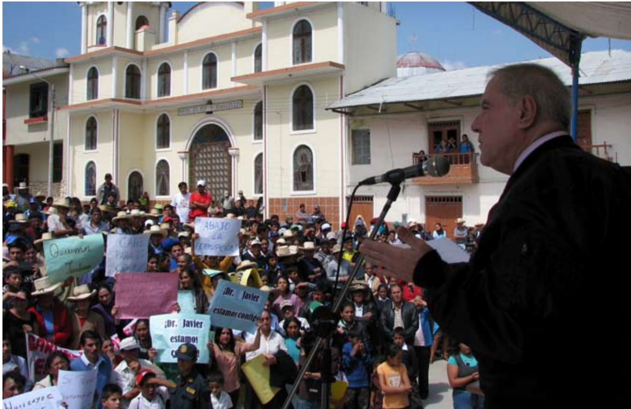
La presencia del Presidente del Poder Judicial en Lajas generó mucha expectativa.