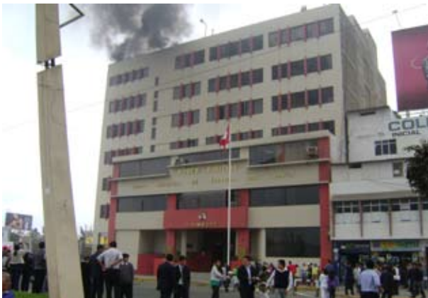
Personal de la sede judicial del Santa hizo frente a simulacro de sismo e incendio

La Corte Superior de Justicia del Santa realizó el 26 de agosto a las 10:00 am., el segundo simulacro de sismo e incendio, y cumplió así el Plan Anual de contingencias del Poder Judicial.