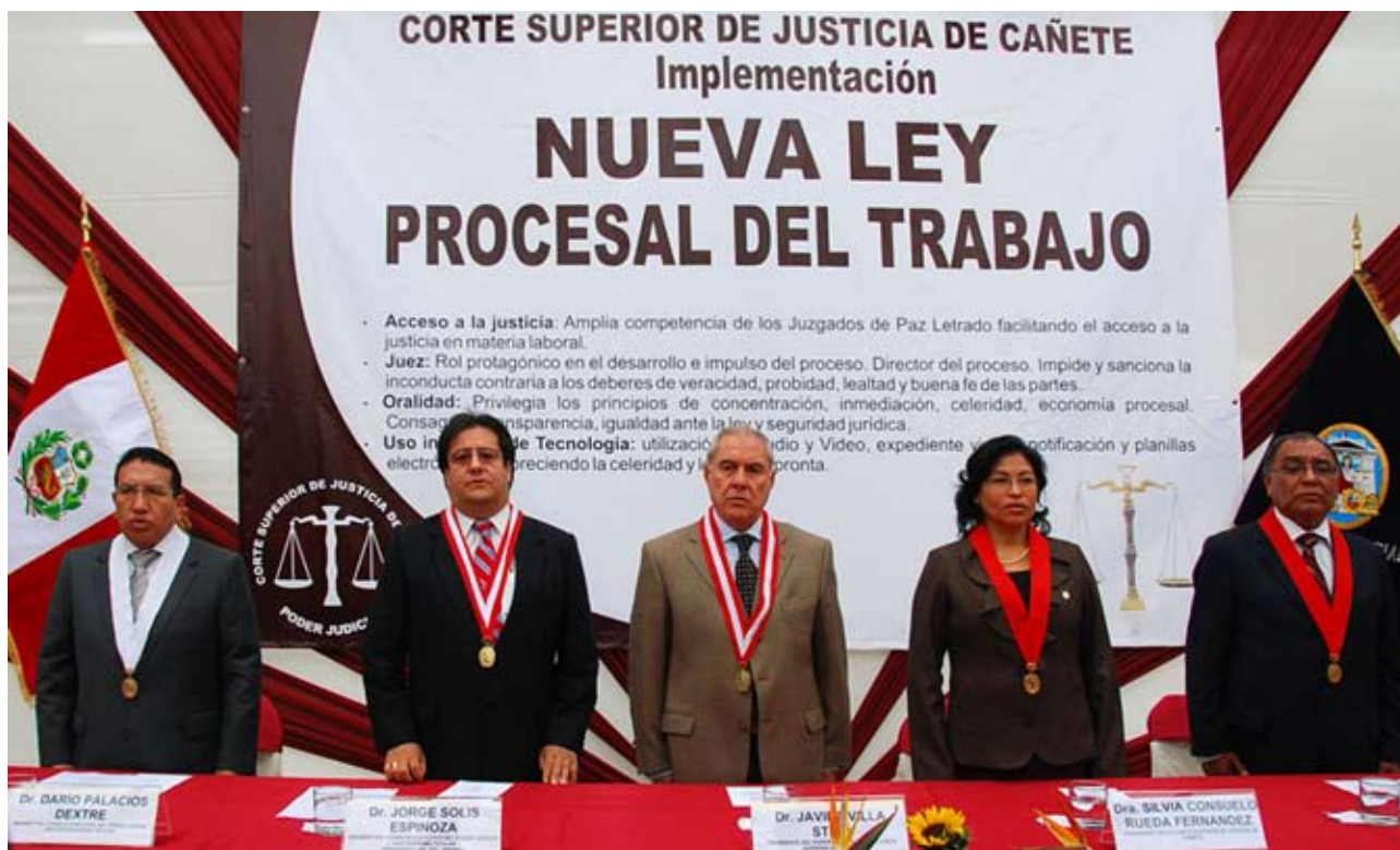
Autoridades Judiciales durante la ceremonia de implementación de la NLPT en Cañete.