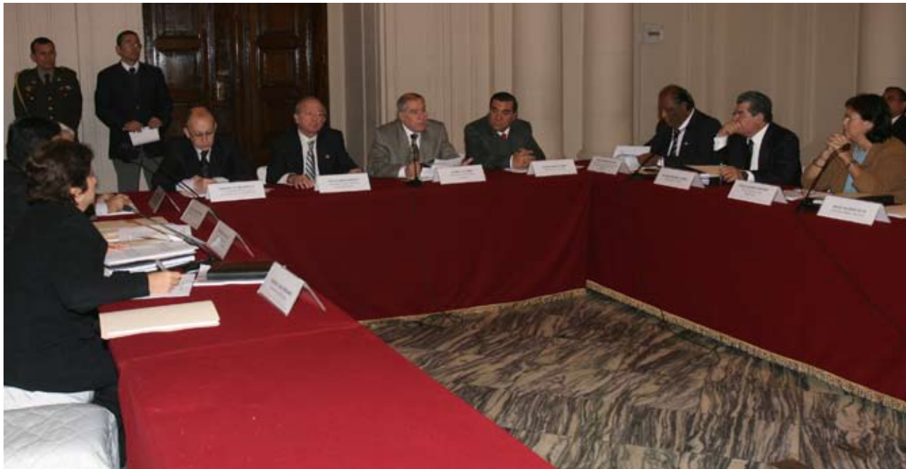
El anuncio fue hecho durante una reunión de la Comisión de Alto Nivel Anticorrupción.

L a publicación en el portal web institucional www.pj.gob.pe , de las sentencias y autos que pongan fin al proceso, o varíen la situación jurídica de los encausados en “casos emblemáticos” de interés de la ciudadanía, dispuso el Consejo Ejecutivo del Poder Judicial (CEPJ), máximo órgano de gobierno de este poder del Estado.