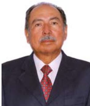
Juez Supremo Titular, Presidente de la Amag. (*)

La Academia de la Magistratura del Perú, de rango constitucional, tiene a su cargo la formación y capacitación permanente de los jueces y fiscales, misión que cumple utilizando la más moderna técnica de información y conocimiento (TIC).