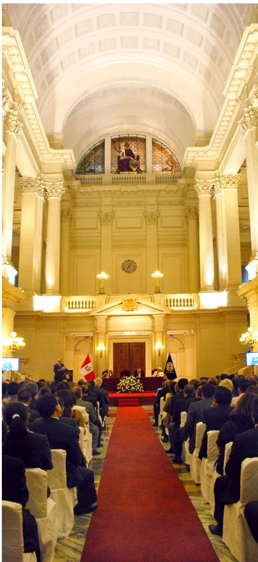
Primera sesión de la Cátedra tuvo una nutrida concurrencia