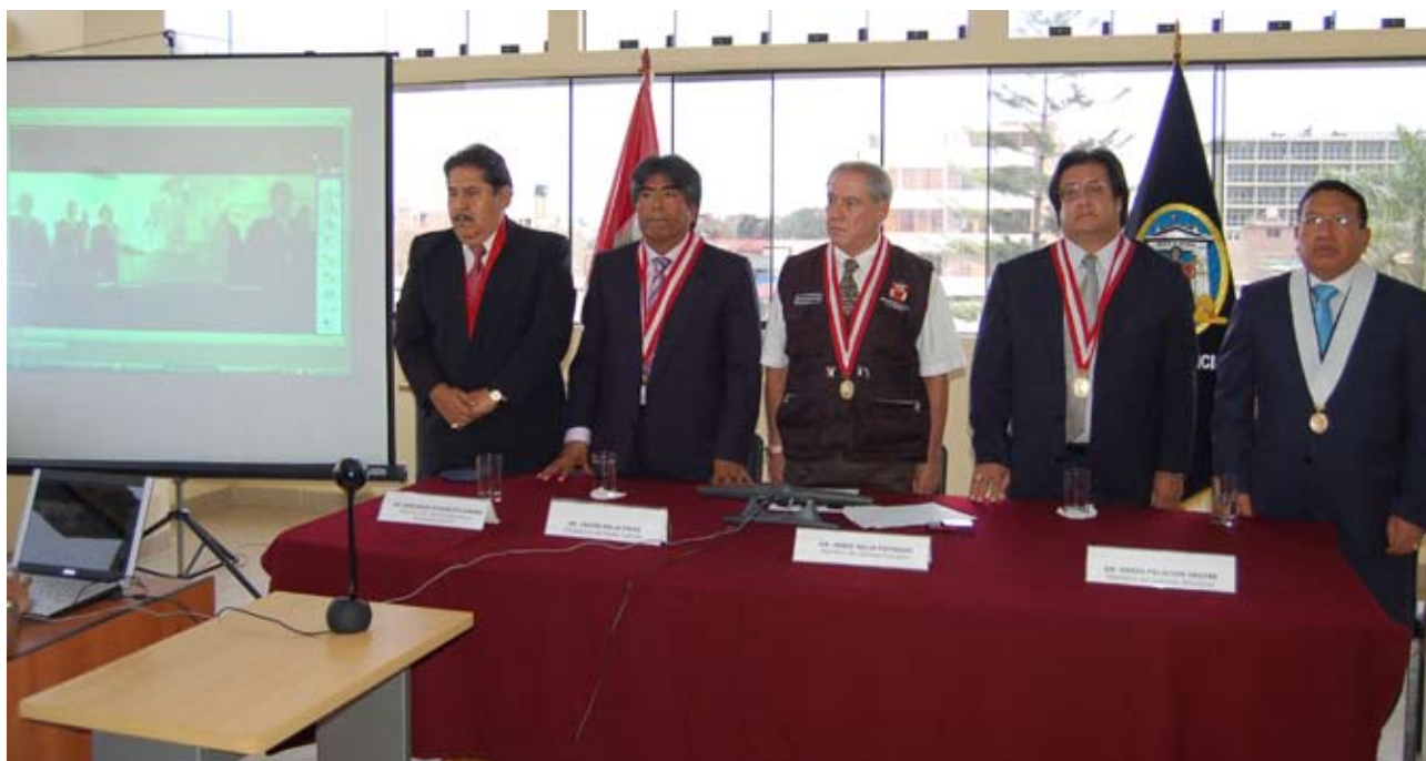
Desde Chiclayo, vía video conferencia se participó en ceremonias realizadas en Amazonas y San Martín