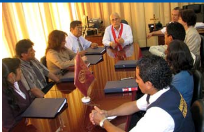
Magistrados y auxiliares jurisdiccionales de Madre de Dios en la sede judicial de Piura.

Cabe señalar que el distrito Judicial de Madre de Dios viene aplicando el Nuevo código Procesal penal desde el 1 de octubre del 2009