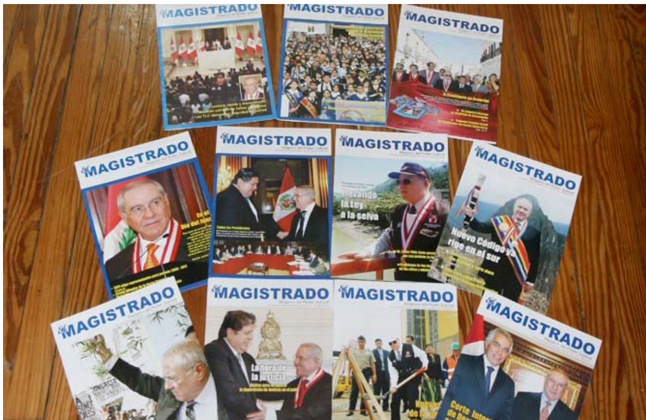
Fotos de las 11 portadas anteriores de la revista El Magistrado.