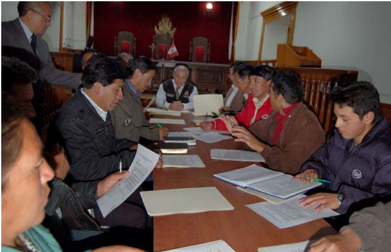
El Presidente del Poder Judicial se reunió con representantes de comunidades nativas de Cajamarca

Indicó que esto es un gran avance porque demuestra que la población está satisfecha con los resultados de la aplicación del nuevo Código.