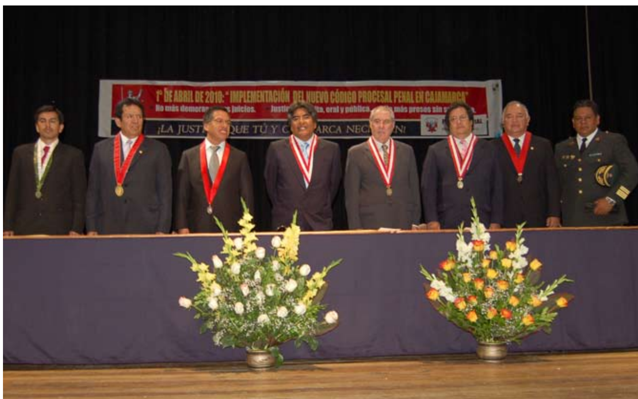
Principales autoridades del Poder Judicial durante ceremonia de entrada en vigencia del NCPP en Cajamarca

Quejas y denuncias por corrupción descienden a cero