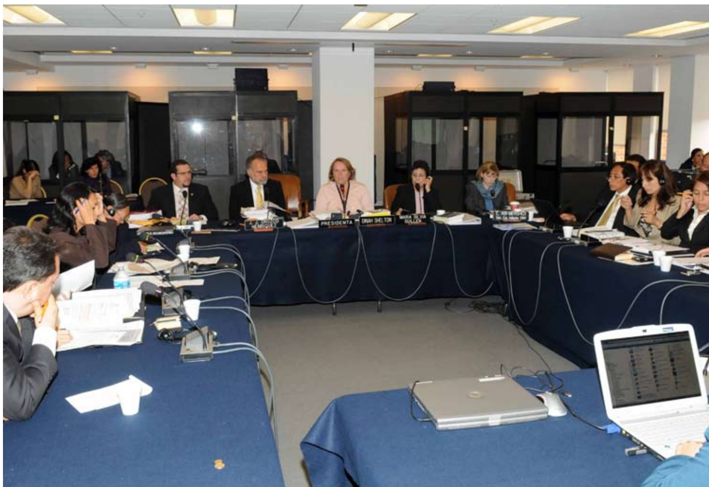
Participantes en el 138º periodo de sesiones de la CIDH