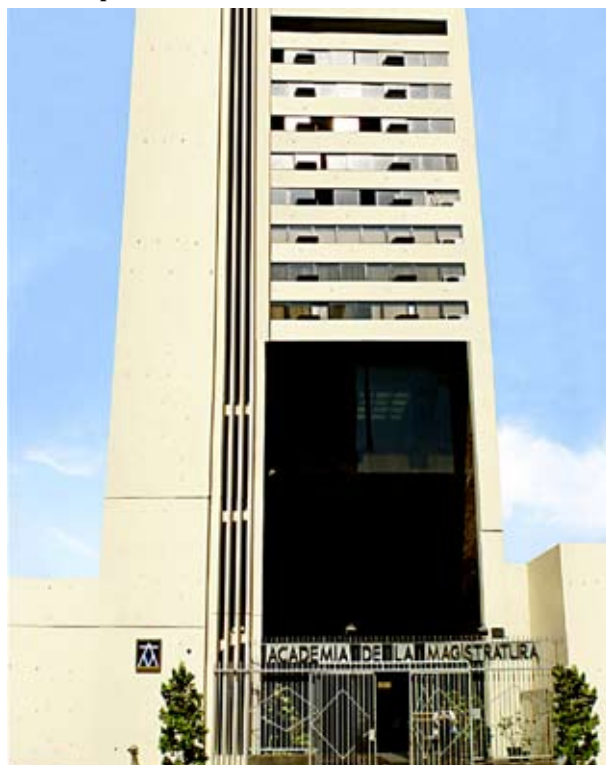
Sede de la Academia de la Magistratura

*Artículo publicado en el diario El Peruano el 26 de marzo de 2010