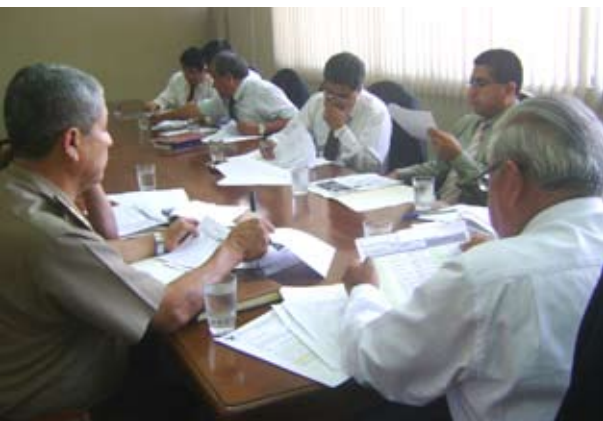
Con la presencia de los operadores de justicia se instaló el Comité Distrital de Implementación del NCPP.

Todos ellos recibieron del doctor Sotelo, una amplia información sobre las responsabilidades de la Comisión con miras a preparar la implementación del Nuevo Código el 1 de octubre próximo.