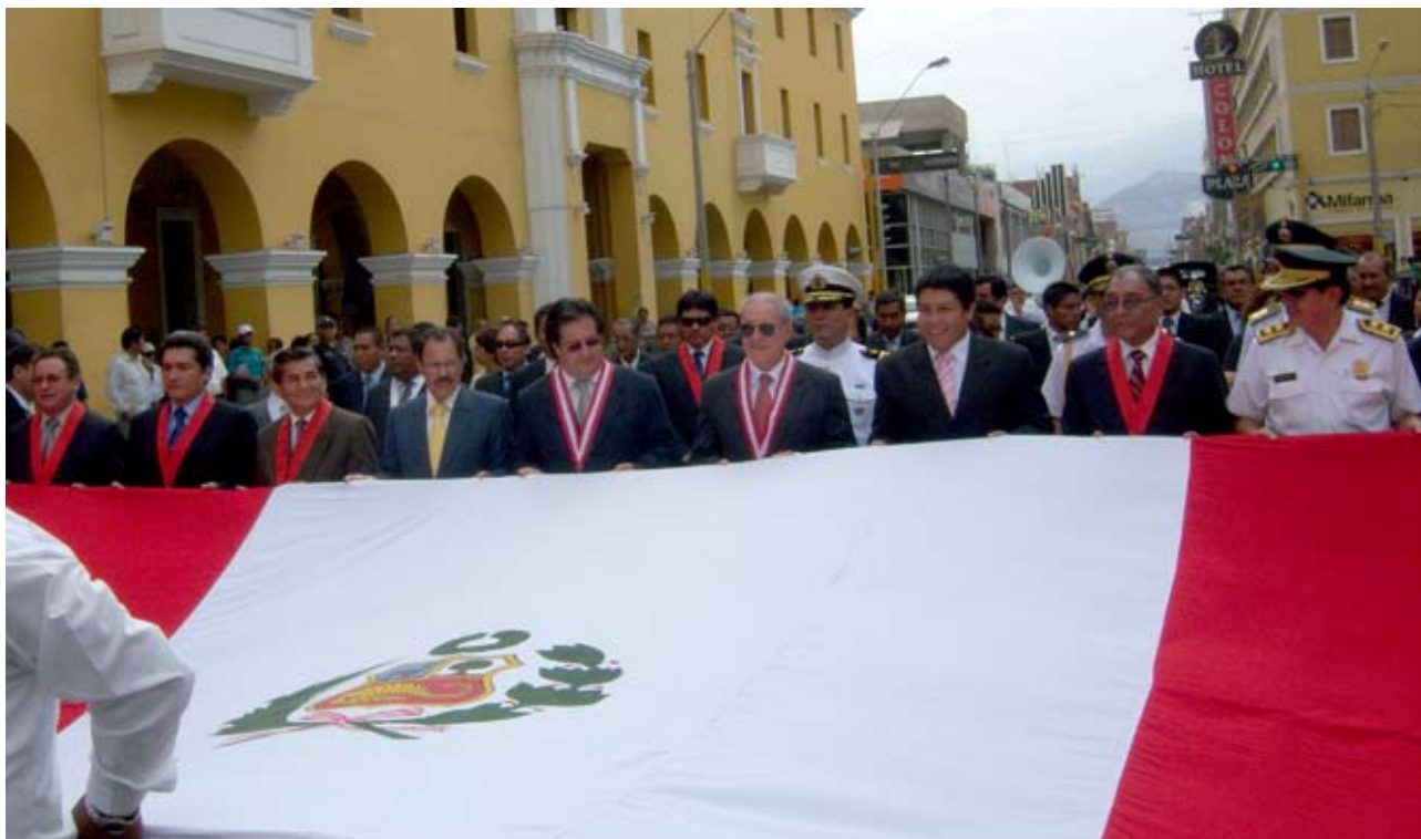
Doctor Javier Villa Stein y magistrados de la Corte Superior de Ica durante paseo del pabellón nacional

Por su parte, el Presidente de la Corte de Ica, Miguel Saavedra, expresó su agradecimiento al doctor Javier Villa Stein y al Consejo Ejecutivo del Poder Judicial por el apoyo que le brindan para el mejor desarrollo de su gestión.