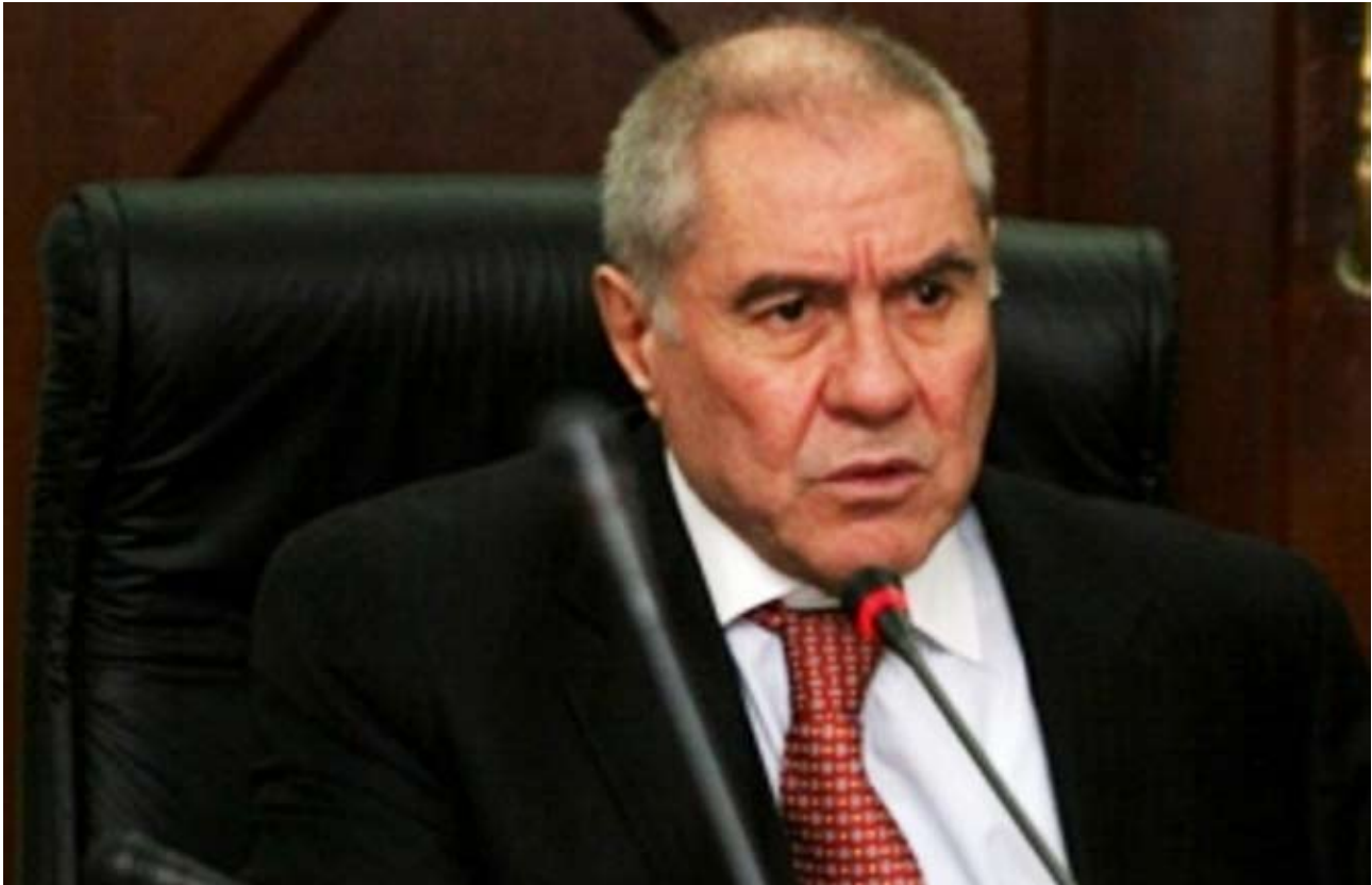
El Presidente del Poder Judicial encabezó la delegación peruana que participó en las sesiones de la CIDH

D urante su participación en el 138° período de sesiones de la Comisión Interamericana de Derechos Humanos (CIDH), en Washington, Estados Unidos, el presidente del Poder Judicial, Javier Villa Stein, afirmó que “el Perú es una república democrática donde rige plena y cabalmente el Estado constitucional y democrático de derecho”.