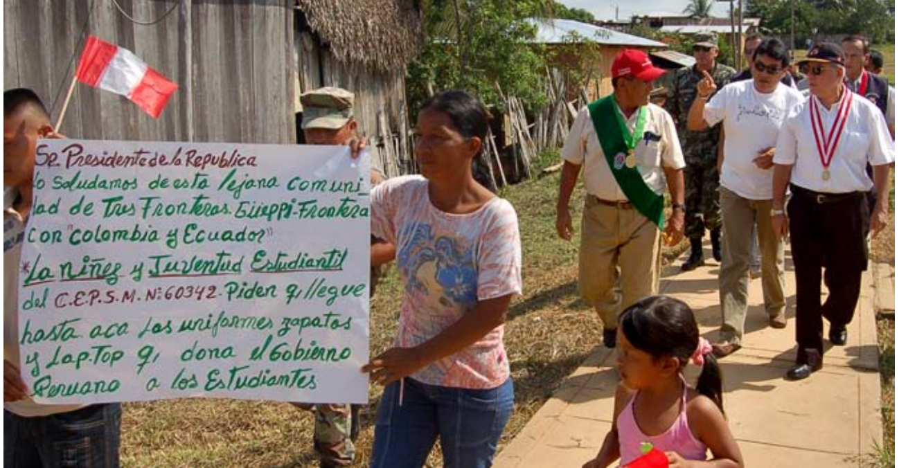
Pobladores recibieron al doctor Villa Stein con pedidos al Gobierno Central

Consideró que se debe ser receptivos con la justicia consuetudinaria y ancestral mediante un diálogo profundo, porque hay propuestas que no son compatibles con el Estado y el derecho internacional. Hay prácticas indígenas que tienen que deponerse, así como también la justicia ordinaria debe dejar de lado ciertos procedimientos que no respetan los convenios internacionales.