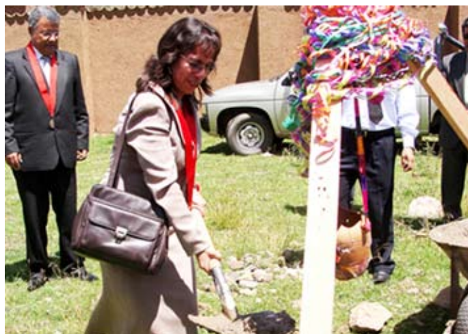
Presidenta de la Sala Mixta de Sicuani, doctora Begonia del Rocío Velásquez, durante la colocación de la primera piedra del local judicial.

El inmueble estará ubicado en el centro de Sicuani, y el costo de la obra será compartido por la Municipalidad Provincial de Canchis y la Corte Superior de Cusco. Durante la ceremonia protocolar, el doctor Somocurcio agradeció el apoyo del alcalde provincial, doctor Mario Velásquez Roque, por acoger un pedido que definitivamente redundará en beneficio de la población de Sicuani. La obra concluirá en setiembre próximo.