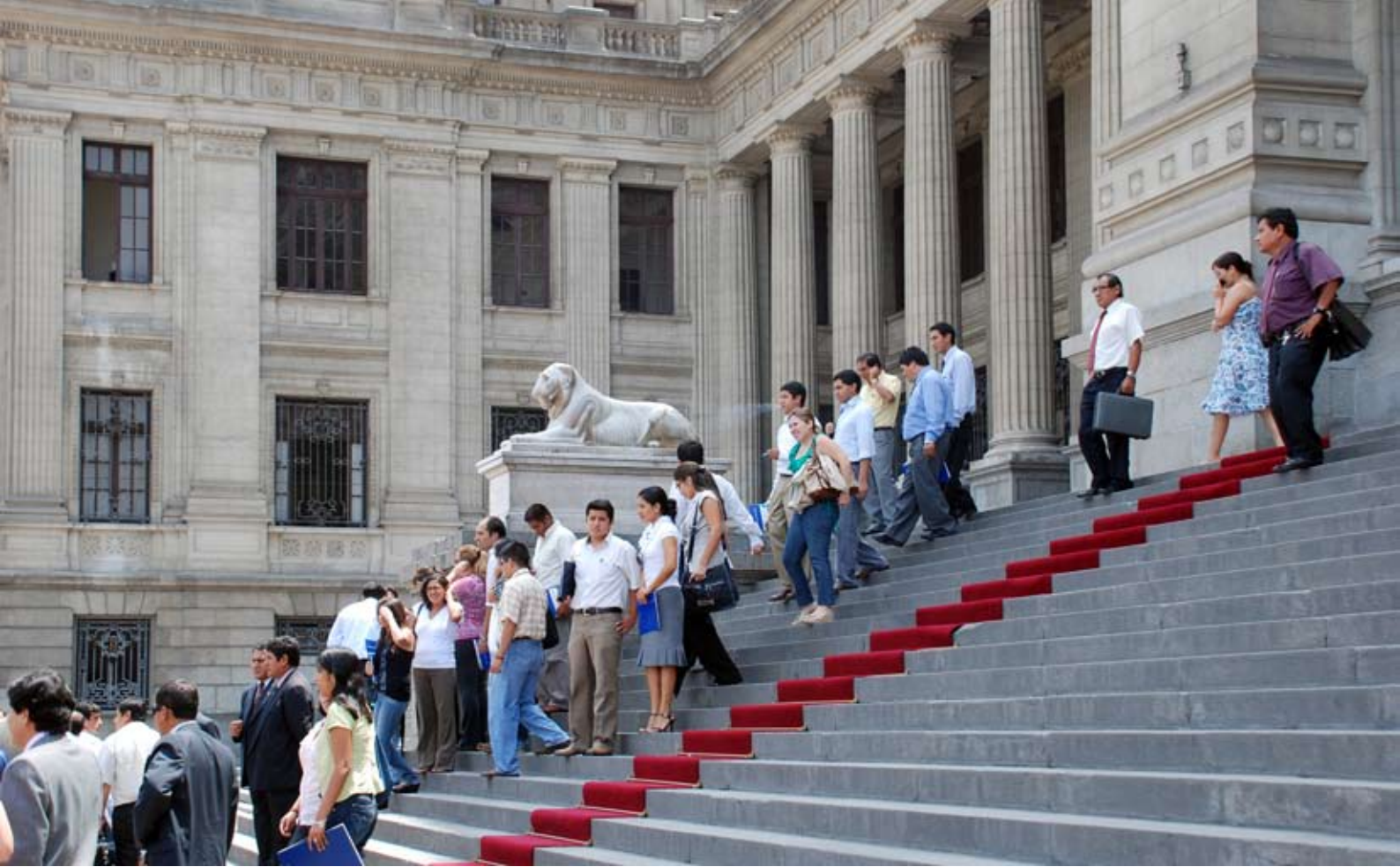
Trabajadores abandonan ordenadamente Palacio de Justicia durante simulacro