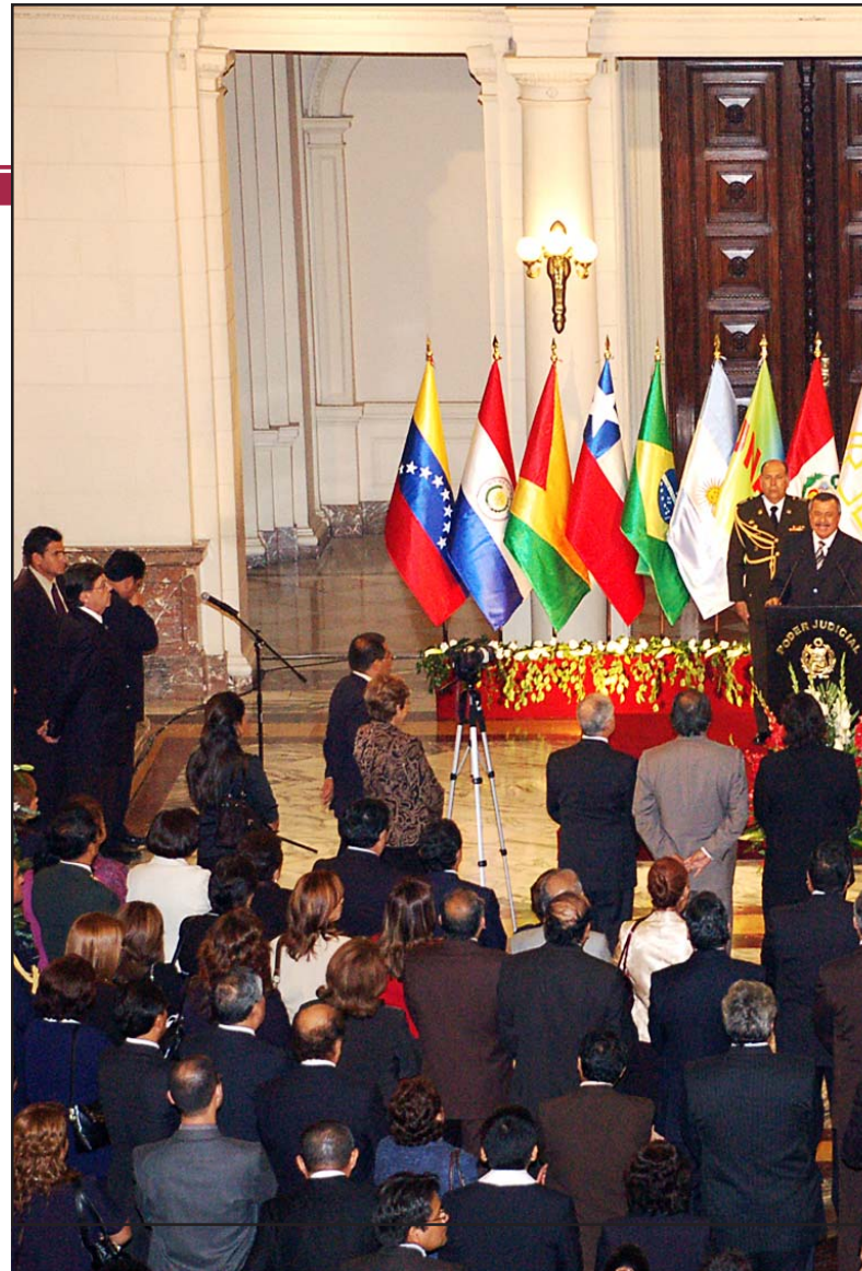
El Presidente del Poder Judicial da la bienvenida a los representantes extranjeros

El Ministro de Economía y Finanzas, Luis Valdivieso se compromete a dialogar para fijar proyecto de Presupuesto para el ejercicio fiscal del 2009. Promete restituir los montos no