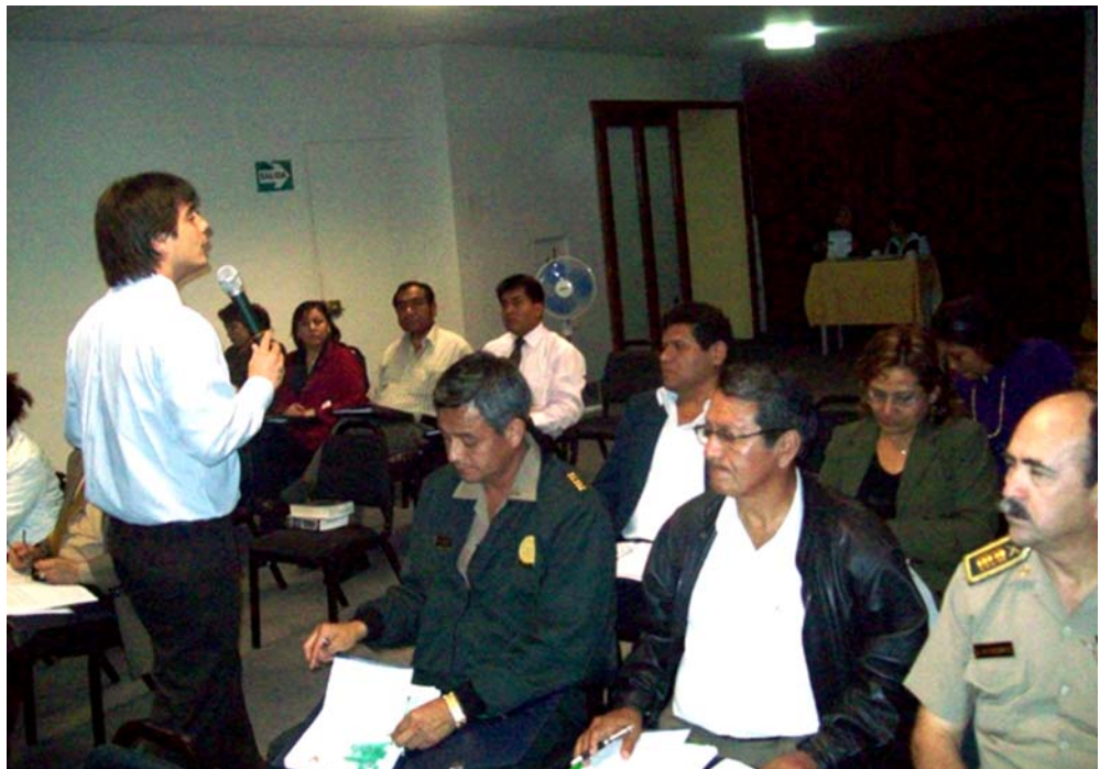
A los talleres de capacitación del Nuevo Código Procesal Penal asistieron jueces, fiscales, efectivos policiales, defensores de oficio y abogados.

De manera paralela, INNOVAPUCP ha realizado la evaluación de los operadores del sistema asistentes al programa de capacitación, para determinar que se logre cubrir las expectativas de los lineamientos de la Secretaría Técnica de la Comisión de Implementación del CPP.