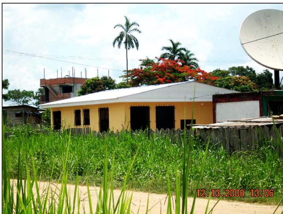
Juzgado de Paz letrado construido en la comisaría de la Policía Nacional del Perú en Tambopata, Distrito Judicial de Madre de Dios

Cabe destacar que la construcción, equipamiento y mobiliario de los Juzgados de Paz Letrados en zonas de frontera ejecutados con el financiamiento no reembolsable de la Unión Europea, reviste gran trascendencia para la comunidad peruana por cuanto mejora los niveles de acceso a la justicia.