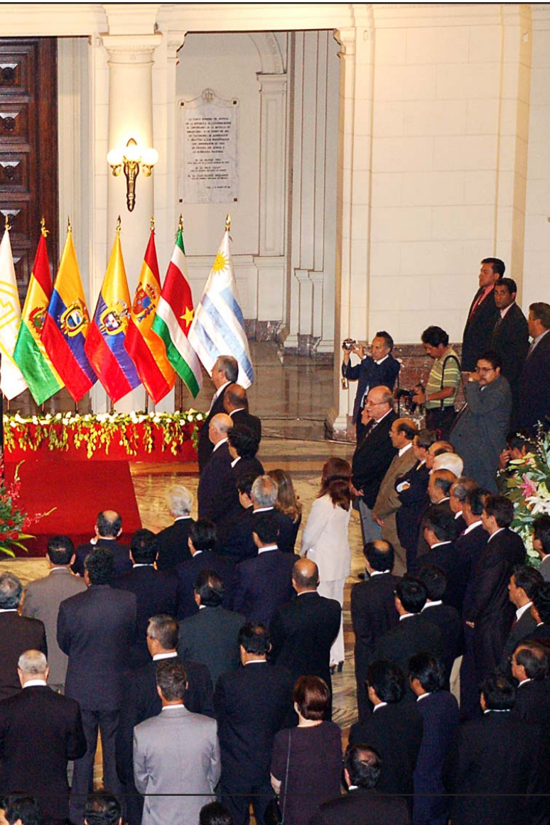
que concurren a la cita de UNASUR, una cita que alcanzó resonancia internacional

Insistió en que no hay que escatimar “ningún esfuerzo para devolver al Poder Judicial la confianza del pueblo, para reconciliar a la justicia con la sociedad peruana”.