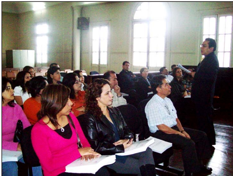
Jueces de Paz Letrados en el Taller que se desarrolla en el Distrito Judicial de Lambayeque