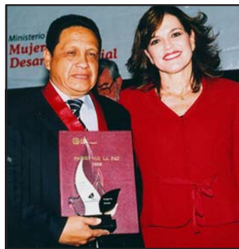
Doctor Pedro Cueto Chumán y ministra de la Mujer, doctora Susana Pinilla

De igual forma, añadió, "mediante charlas a la población se trata de desterrar el concepto de que el juez es inaccesible, puesto que hay un mayor acercamiento con la comunidad en busca de recuperar su confianza y credibilidad".