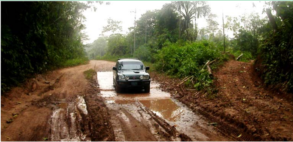
Camioneta de la Corte de Ucayali, que transporta al equipo de prensa, cruza un tramo de la carretera convertido en fango

fianza”, sonríe. Aunque quisiera, dice, no puede imponer horario de oficina en su despacho “porque en la noche trabajo y en las mañanas atiende, y también los sábados y domingos. Esta es mi casa y aquí he habilitado un espacio para la oficina”, señaló.