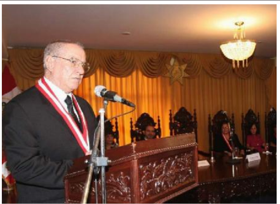
El doctor Villa Stein pone en marcha el Nuevo Código Procesal Penal en el distrito judicial de Lambayeque

Ilusiones de soles en la infraestructura, equipamiento, capacitación para todos los operadores del NCPP.