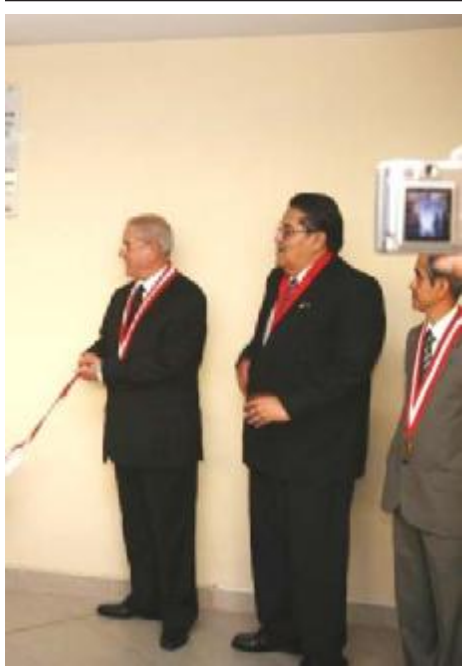
Magistrados de poner en práctica el Nuevo Código Procesal Penal