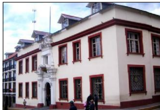
Casa de la Justicia de Puno