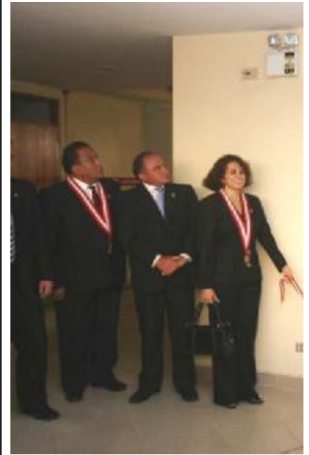
Inauguración de ambientes para juzgado Código

Expresó que ahora el Poder Judicial “no se se detiene a pedir, sino a dar solución rápida a los conflictos”, y contribuye así al crecimiento económico del país, a garantizar la paz social, y a fortalecer el Estado constitucional y democrático de Derecho.