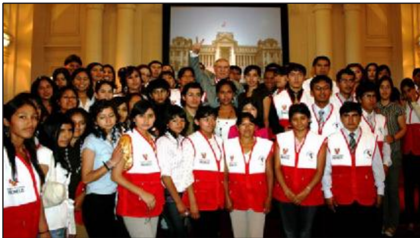
El Presidente Villa Stein con estudiantes del Pronelis

rechos Humanos, Conciliación Extrajudicial, Derecho a la participación, Arbitraje Popular, comunicación efectiva, liderazgo y otros relacionados con la ética y moral.