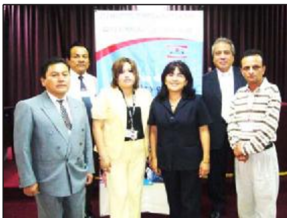
Representantes de Odajup-Callao con jueces de paz