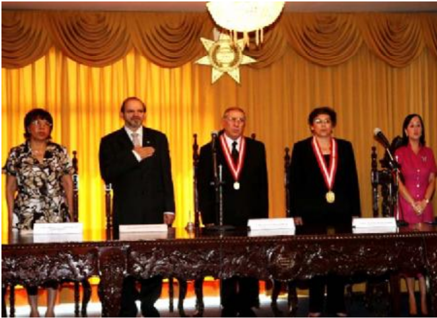
El doctor Javier Villa Stein, el premier Yehude Simon, las ministras Mercedes Cabanillas, Rosario Fernández y la Fiscal de la Nación Gladys Echaíz en Chiclayo