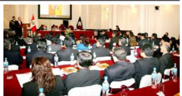
Presidentes y funcionarios de Cortes Superiores participan en el Taller