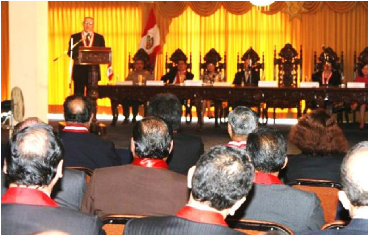
El doctor Javier Villa Stein durante la ceremonia de inauguración de la vigencia del Nuevo Código Procesal Penal en Lambayeque