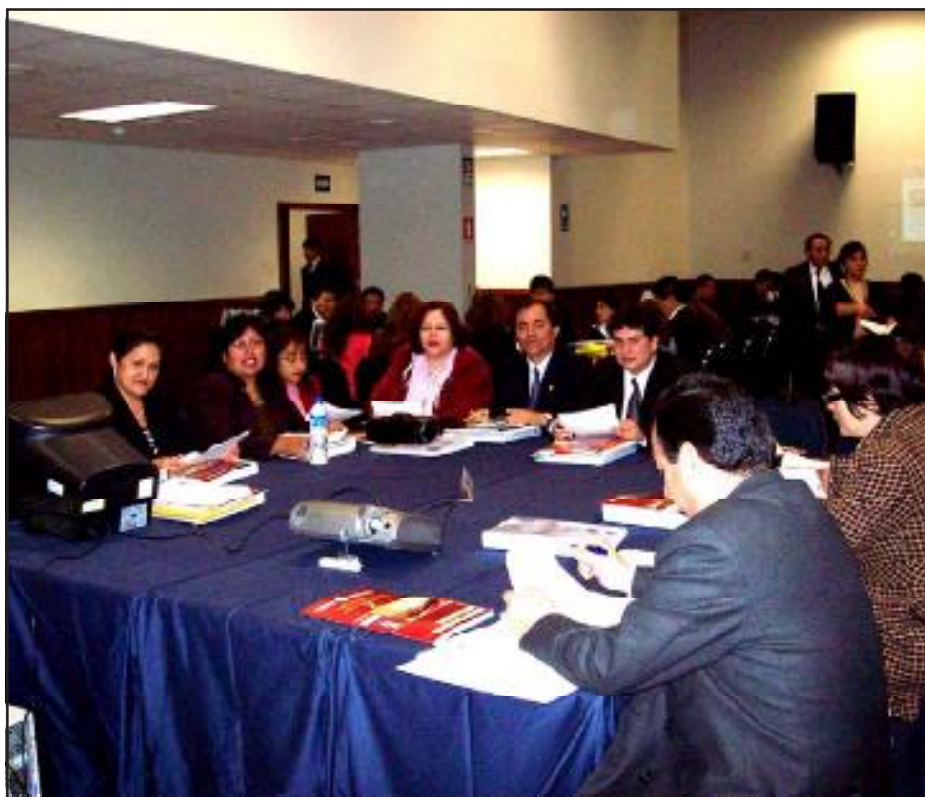
Magistrados, fiscales y abogados de oficio participaron en los talleres de trabajo