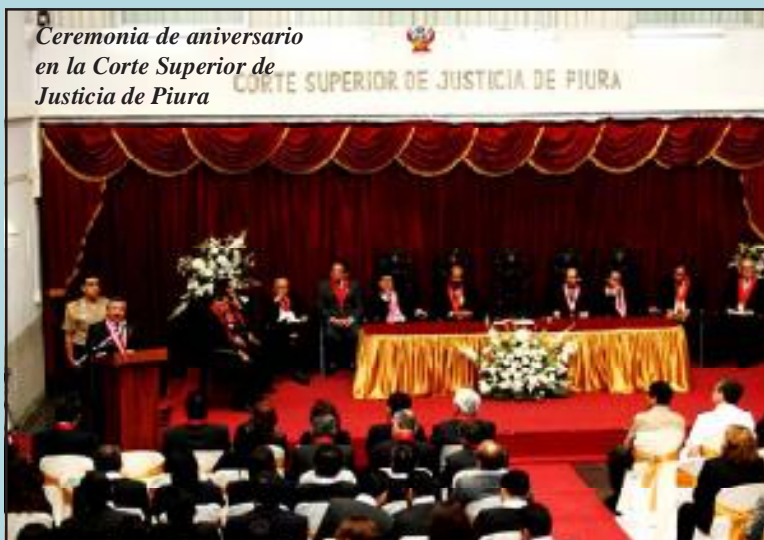
Ceremonia de aniversario en la Corte Superior de Justicia de Piura

Informó que la Sala Plena viene discutiendo una importante y muy sustentada iniciativa de reforma del Sistema de Justicia contemplado en la Constitución, instituyendo cambios que buscan reconocer al Poder Judicial la atribución de instaurar procesos de inconstitucionalidad y que sea la Corte Suprema el órgano con competencia exclusiva para conocer todo el proceso de extradición.