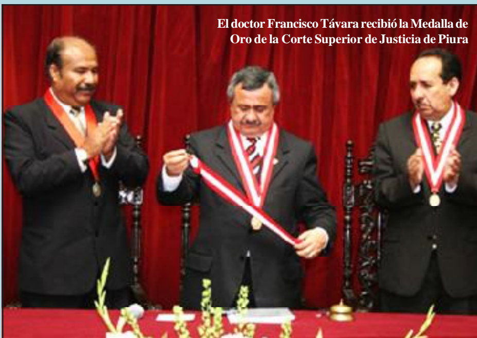
El doctor Francisco Távora recibió la Medalla de Oro de la Corte Superior de Justicia de Piura

os méritos actuales de ese distrito judicial obtenido el reconocimiento a nivel nacional la producción alcanzada en la Evaluación Plan Operativo 2007, cuando ha ocupando lugar después del distrito Judicial por haber resuelto 69,307 expedientes, es al 7 % del total de 1'059,835 expedientes en toda la República.