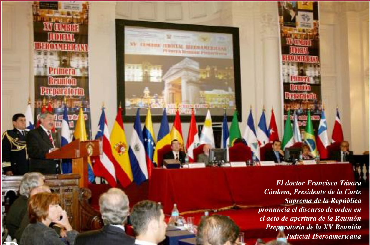
El doctor Francisco Távora Córdova, Presidente de la Corte Suprema de la República pronuncia el discurso de orden en el acto de apertura de la Reunión Preparatoria de la XV Reunión Judicial Iberoamericana

D urante tres días, en el marco de la Primera Reunión Preparatoria de la XV Cumbre Judicial Iberoamericana, cincuenta altas autoridades de los Poderes Judiciales de 23 países, incluidos España, Portugal y Andorra, debatieron la forma en que sus respectivas naciones tengan acceso a una justicia eficaz y eficiente, mediante nuevas acciones judiciales y el uso de un adecuado presupuesto para sus actividades.