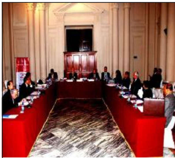
Magistrados o participantes en el Pleno Jurisdiccional de

marco de su Plan Operativo Anual, durante el ejercicio 2008, ha venido apoyando en la ejecución de plenos jurisdiccionales a nivel regional, nacional y supremo, en la medida que puntualiza como objetivo generar uniformidad