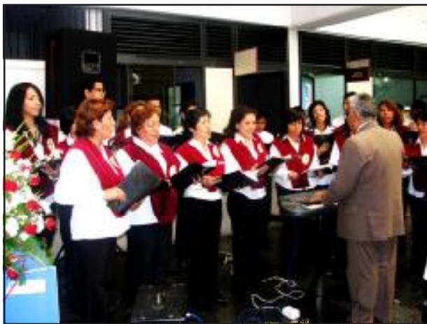
El coro polifónico de la Corte Superior de Justicia de Piura durante su actuación en el homenaje a César Vallejo que coincidió con el aniversario de esa dependencia judicial

El Poder Judicial ha organizado anteriormente actos de desagravio y homenaje a César Vallejo en Lima y Trujillo con la participación de instituciones culturales, entre ellas la Universidad Alas Peruanas y la Universidad César Vallejo y la Alianza Francesa.