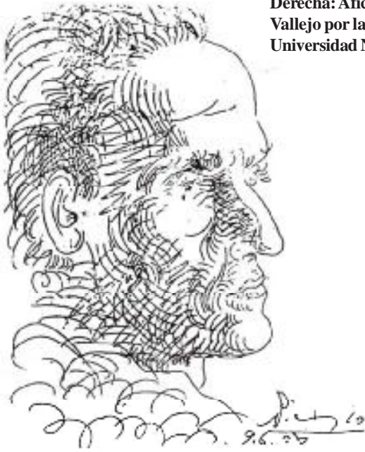
César Vallejo en un apunte de Picasso. Derecha: Afiche que anuncia el homenaje a Vallejo por la Corte Superior de Piura y la Universidad Nacional de Piura