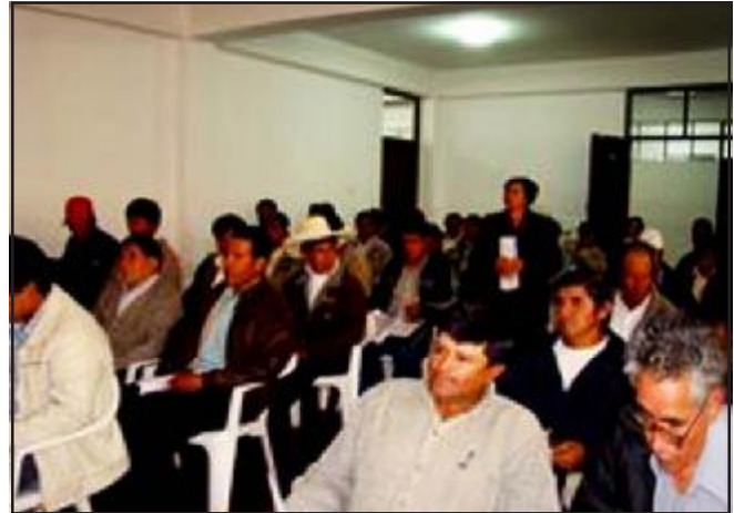
Jueces de Paz se capacitan en Cajamarca

En coordinación con la Oficina Nacional de Apoyo a la Justicia de Paz (ONAJUP), en el mes de Diciembre se realizaron adicionalmente tres Talleres de Inducción dirigido a nuevos jueces de paz de los Distritos Judiciales de Cajamarca, Huaraz y Puno, en materias de derechos fundamentales, género, infancia, violencia familiar, pluralismo cultural, técnicas conciliatorias y competencias propias.