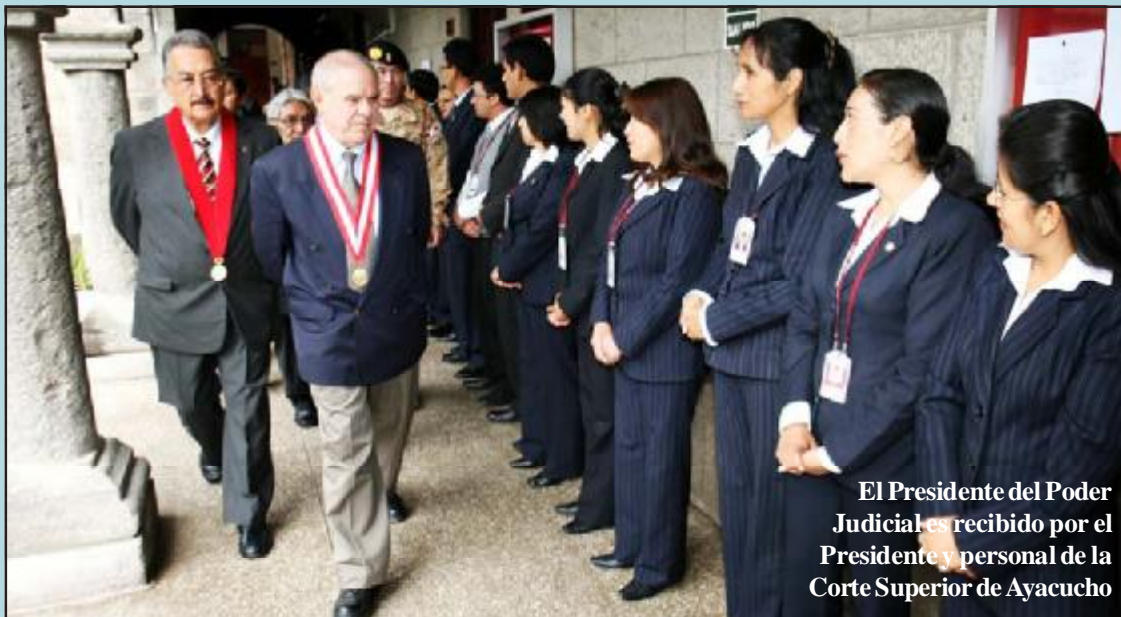
El Presidente del Poder Judicial es recibido por el Presidente y personal de la Corte Superior de Ayacucho