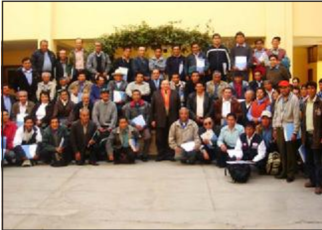
Un descanso en la tarea de capacitación en Huaraz