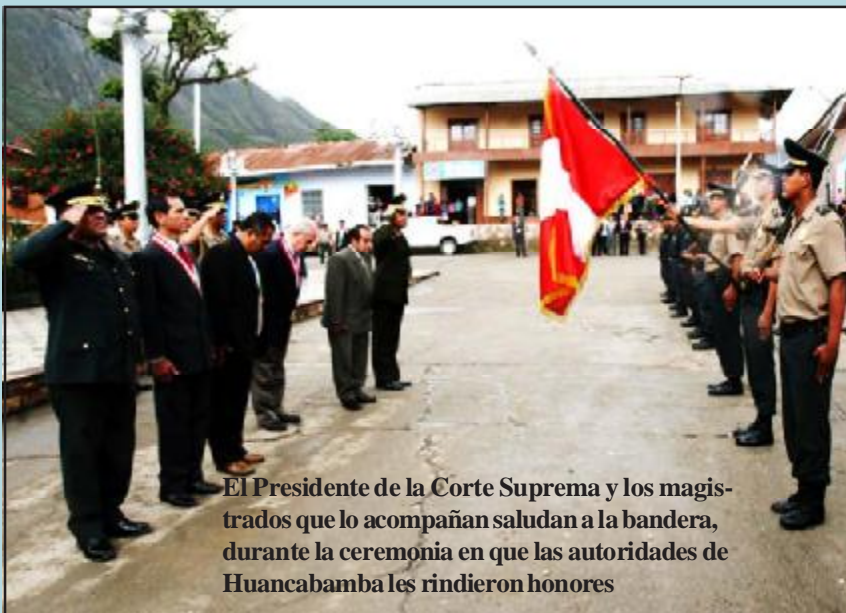
El Presidente de la Corte Suprema y los magistrados que lo acompañan saludan a la bandera, durante la ceremonia en que las autoridades de Huancabamba les rindieron honores