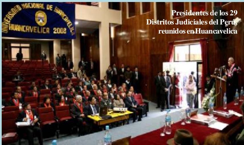
Presidentes de los 29 Distritos Judiciales del Perú, reunidos en Huancavelica