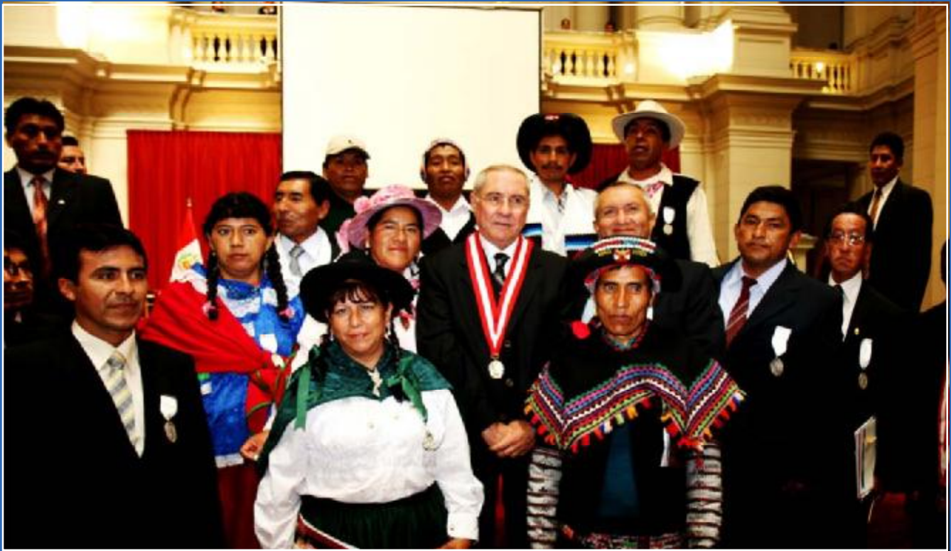
El Presidente del Poder Judicial, doctor Javier Villa Stein, rodeado por los jueces de paz de distintos lugares del Perú, invitados especialmente para la solenne ocasión

También anunció que propondrá la aprobación de una directiva que deberán imponer los magistrados a los abogados que operen articulaciones maliciosas.