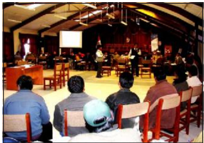
Jueces de Paz de Puno en el auditorio de su sede judicial

La realización de los Talleres de Inducción reviste gran trascendencia para la comunidad peruana en general pues mejora las capacidades de nuestros jueces de paz a nivel nacional en la resolución de conflictos.