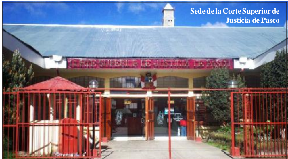
Sede de la Corte Superior de Justicia de Pasco