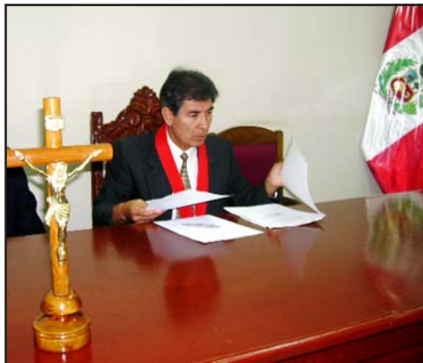
Doctor Isaac Rubio Zevallos, Presidente de la Corte Superior de Justicia de Arequipa

Acondicionamiento de ambientes para la Implementación del Nuevo Código Procesal Penal en la provincia de Islay, Mollendo. El Consorcio Alzamora bajo la Adjudicación N° 014-2008-CEP-CSJAR/PJ se hizo cargo de las obras que demandaron una inversión de 87,889 nuevos soles con un compromiso de tiempo de ejecución de 5 días.