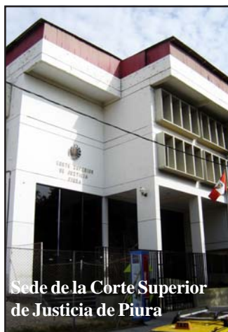
Sede de la Corte Superior de Justicia de Piura