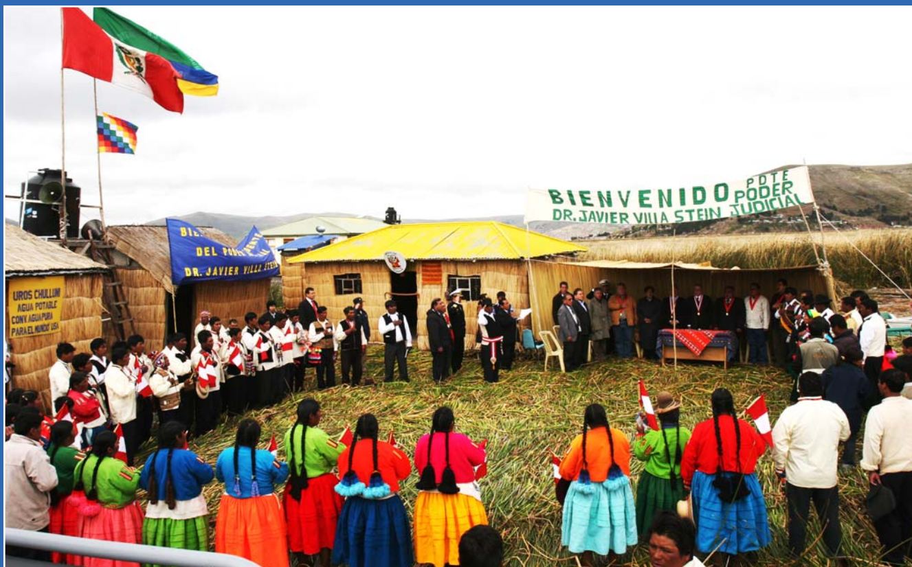
Delegaciones de pobladores de 50 islas flotantes del lago Titicaca asisten a la ceremonia de instalación del Juzgado flotante e itinerante del distrito Uros-Chulluni, el primero de su género en el mundo