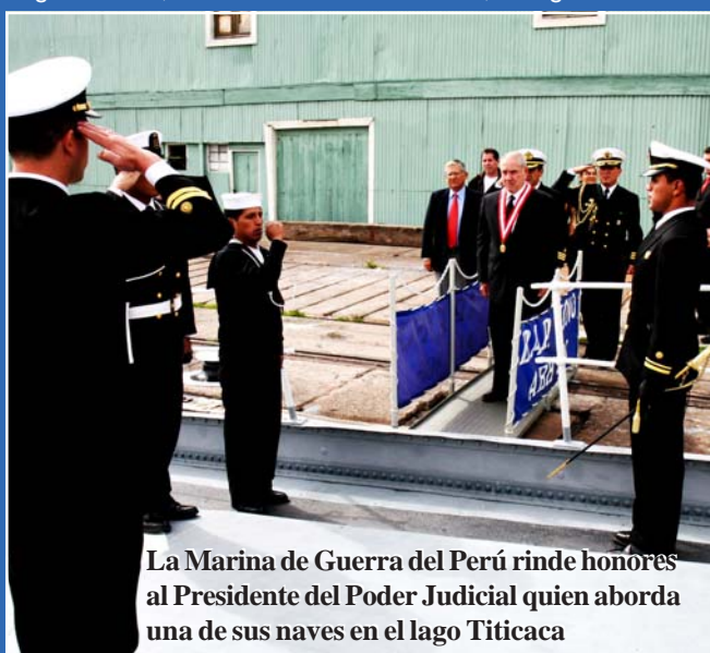
La Marina de Guerra del Perú rinde honores al Presidente del Poder Judicial quien aborda una de sus naves en el lago Titicaca

Más tarde, el Presidente participó en una ceremonia en la sede de la Corte Superior de Justicia de Puno, donde tam-