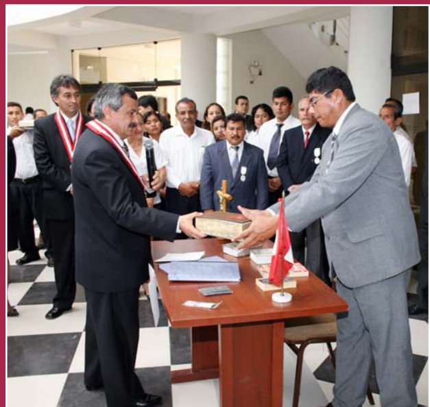
Entrega simbólica de una Biblia a los Jueces de Paz