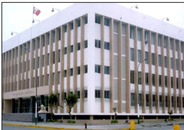
Sede de la Corte Superior de Justicia del Callao.