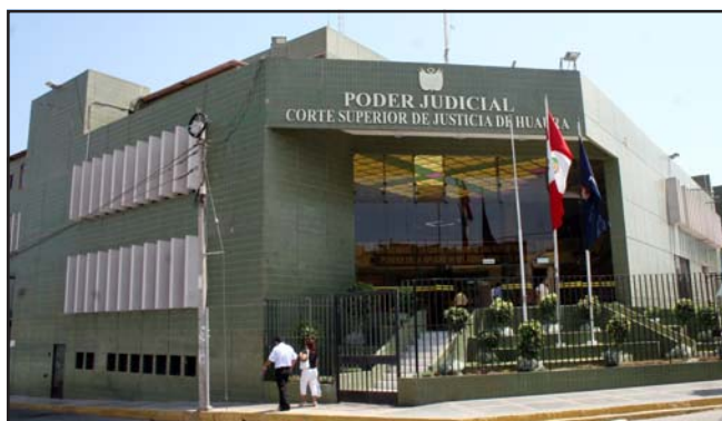
Casa de la Justicia de Huaura