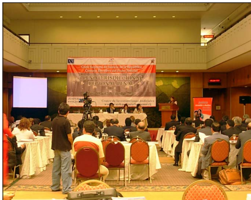
Pleno Jurisdiccional de Lima realizado en el Hotel Sheraton

Los Plenos Jurisdiccionales son reuniones de magistrados superiores, quienes discuten en forma sistematizada diversos temas de relevancia jurídica a fin de establecer criterios interpretativos uniformes y concordar la jurisprudencia para fomentar la predictibilidad de las resoluciones judiciales y mejorar el nivel de confianza ciudadana en el Poder Judicial.