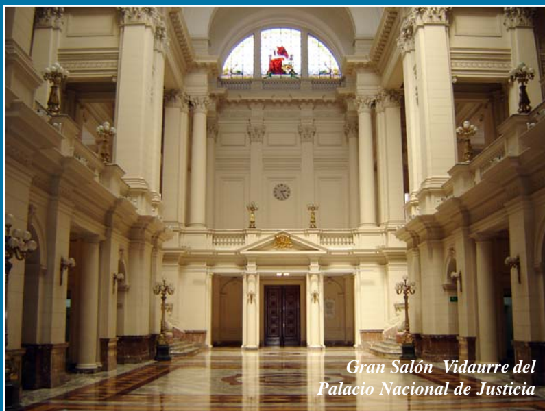
Gran Salón Vidaurre del Palacio Nacional de Justicia

Estará ubicado en ambientes del Palacio Nacional de Justicia, imponente edificio de estilo clásico europeo, construido en la década de los años 30 del siglo pasado, situado en área vital de la capital, en lo que se denomina el Centro Histórico de Lima, donde se encuentran asimismo, inmuebles dedicados a la difusión de