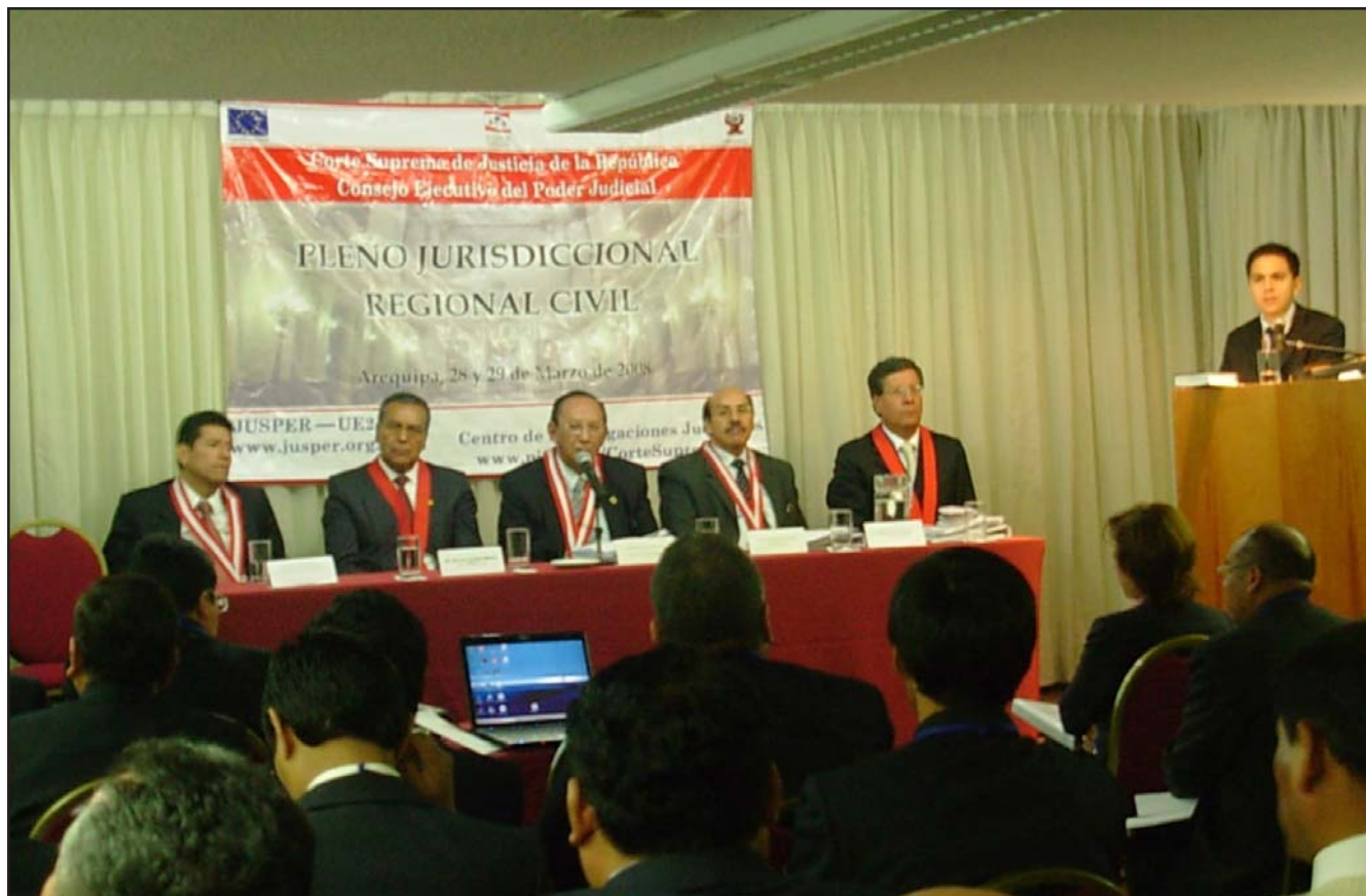
Sesenta magistrados de las Cortes Superiores de Justicia del Sur del Perú participaron en el Pleno Jurisdiccional de Arequipa

E l proyecto JUSPER y el Centro de Investigaciones Judiciales del Poder Judicial realizaron el Pleno Jurisdiccional Regional Civil en Arequipa en donde los magistrados superiores de diversos distritos judiciales se reunieron para uniformar criterios interpretativos y concordar la jurisprudencia que permita fomentar la predictibilidad de las resoluciones judiciales.