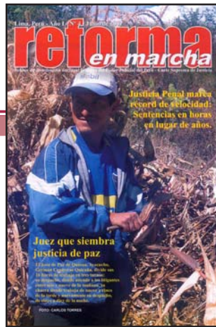
Con la Justicia de Paz