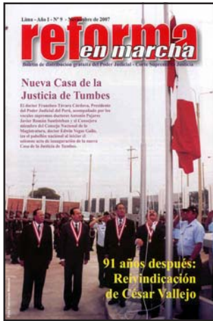
Reivindicación del Poeta