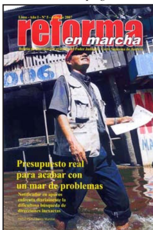
Se plantea presupuesto real