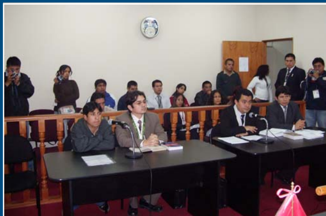
Sentencia rápida en el caso de la bebé asesinada

Los tres sujetos, además, fueron procesados por la muerte de la ciudadana Maruja Toca Huamán, secuestro de un empresario y asalto a dos grifos, entre otros. Los procesados acudieron a la audiencia en el penal de Carquín acompañados por sus abogados de oficio quienes solicitaron acogerse a la conclusión anticipa-