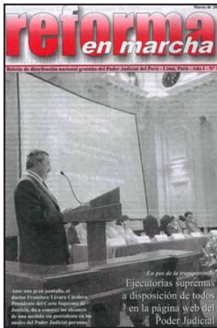
Se anuncia la página web