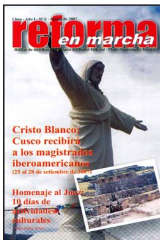
Brazos abiertos en el Cusco