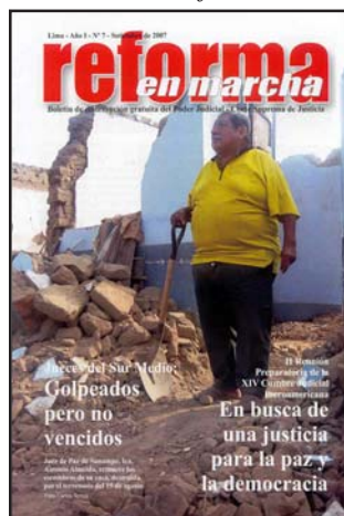
Juez de paz entre escombros