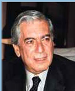
Mario Vargas Llosa

Vargas Llosa dijo en el programa periodístico La ventana indiscreta de canal 2 de televisión: "Me parece que es un juicio que está llevándose a cabo con absoluta legalidad. Estoy muy impresionado. He seguido bastante de cerca el juicio y la verdad, nosotros criticamos mucho al Poder Judicial peruano y con muchas razones, pero este juicio hasta ahora se está llevando de una manera impecable con gran neutralidad de parte de los jueces, los derechos de la defensa están enteramente reconocidos".