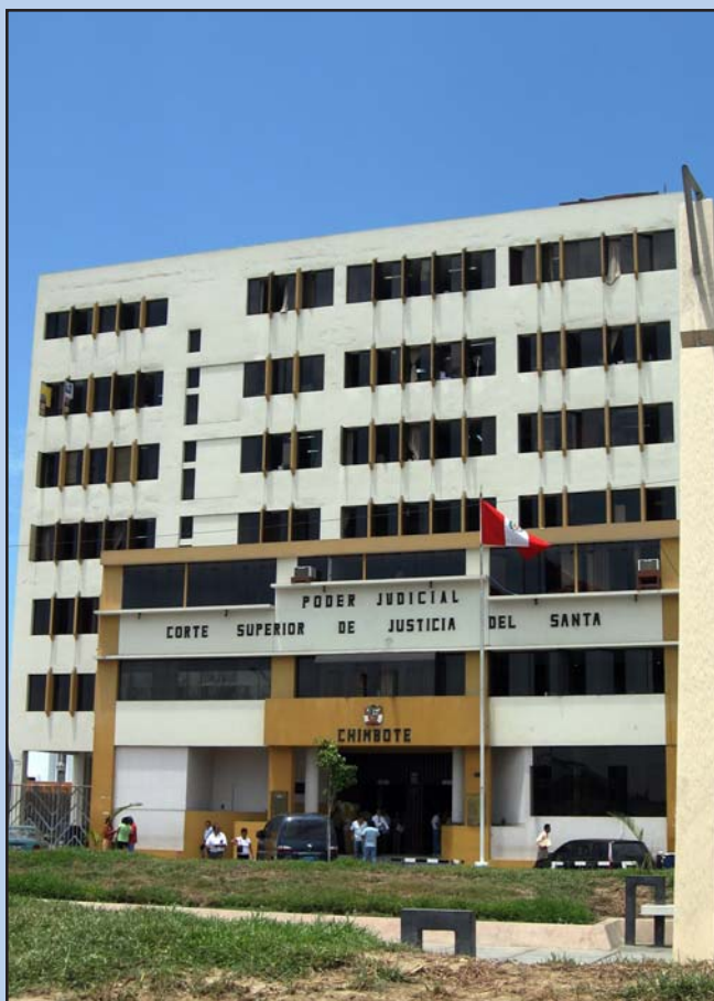
Edificio de siete pisos de la Corte Superior del Santa, ha quedado chico para las necesidades de la justicia

cesados en determinados casos”, se anticipó. En cuanto a las necesidades que la Corte enfrenta en la actualidad, el doctor Ticona señaló que su parque informático es insuficiente, debido a la creación de nuevos juzgados y a que la cercanía del mar, ha provocado un problema especial de corrosión de los equipos.