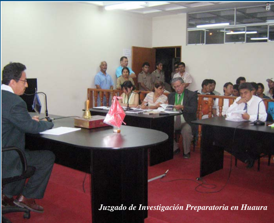
Juzgado de Investigación Preparatoria en Huaura