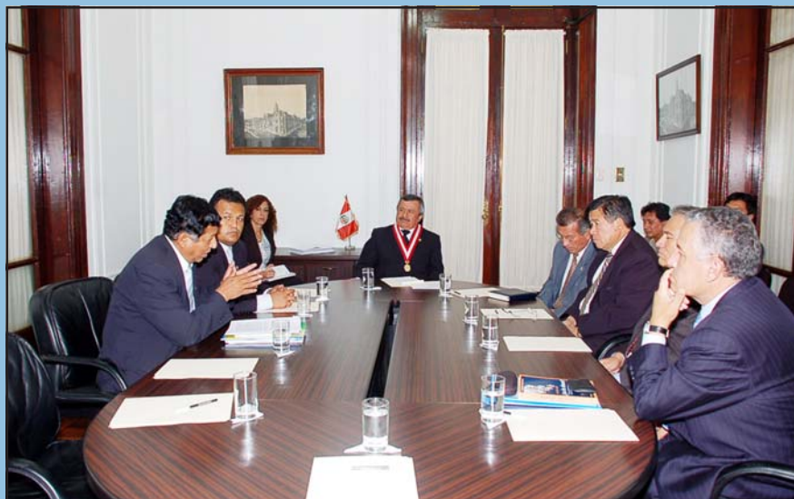
Presidentes regionales reiteran su decisión de apoyar a las Cortes Superiores de sus áreas

Las palabras del doctor Távara tuvieron lugar durante la reunión que sostuvo con cinco presidentes de Gobiernos Regionales y con el Presidente de la Comisión Especial Encargada de Evaluar la situación de las Cooperativas del país.