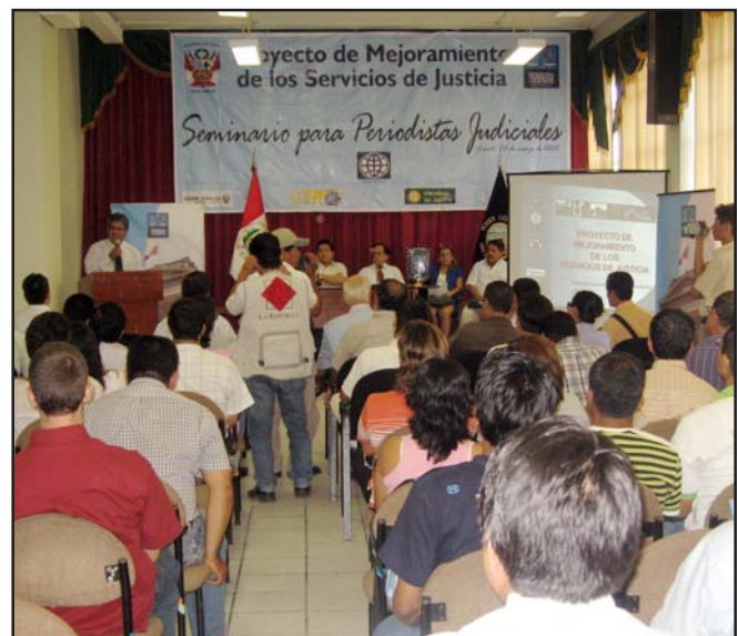
Seminario para periodistas organizado por el PMSJ en la Corte Superior de Justicia de Loreto