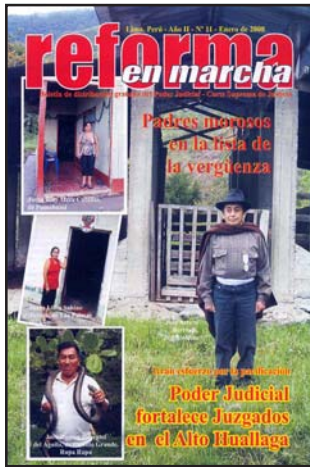
Jueces en zona peligrosa