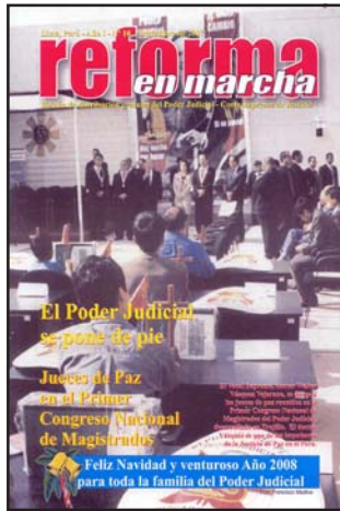
Primer Congreso Nacional