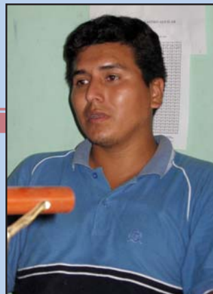
Yen Lord Castro Aguilar , juez de San Pedro