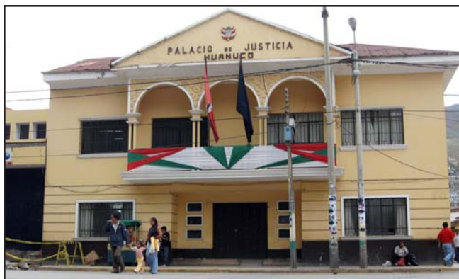
Casa de la Justicia de Huánuco