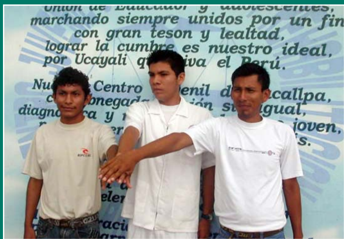
Ejemplos emblemáticos: siguen estudios superiores