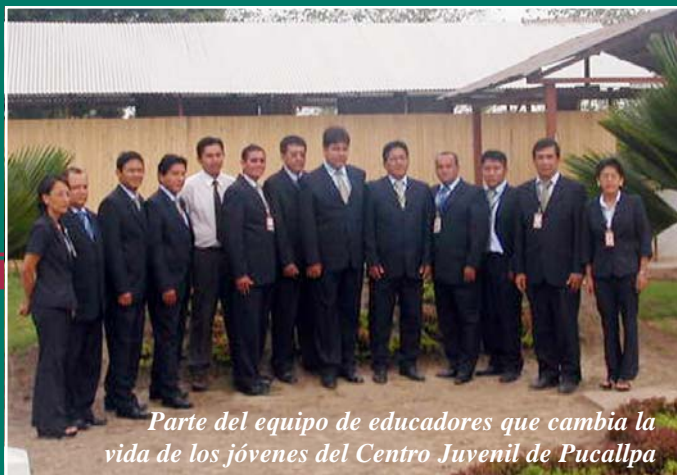
Parte del equipo de educadores que cambia la vida de los jóvenes del Centro Juvenil de Pucallpa

soportar. Este chico salió a declamar su poema pero no estaba su mamá -después supimos que no vino porque no tenía un par de soles para el pasaje- y lo hizo con tal énfasis que se puso a llorar y nos hizo llorar a todos”.