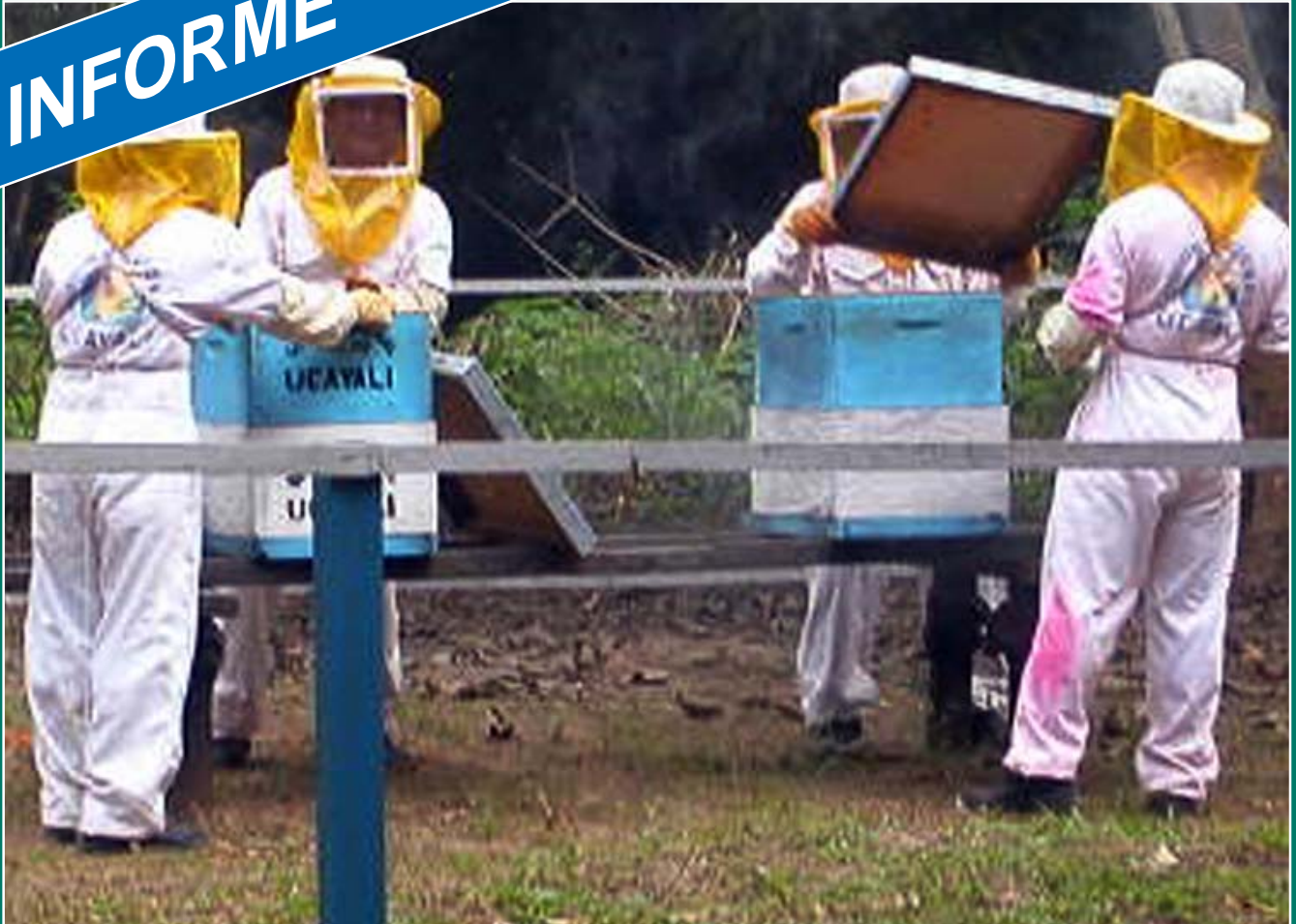
Vestidos como astronautas, cuatro internos se enfrentan a las abejas en vísperas de su primera cosecha