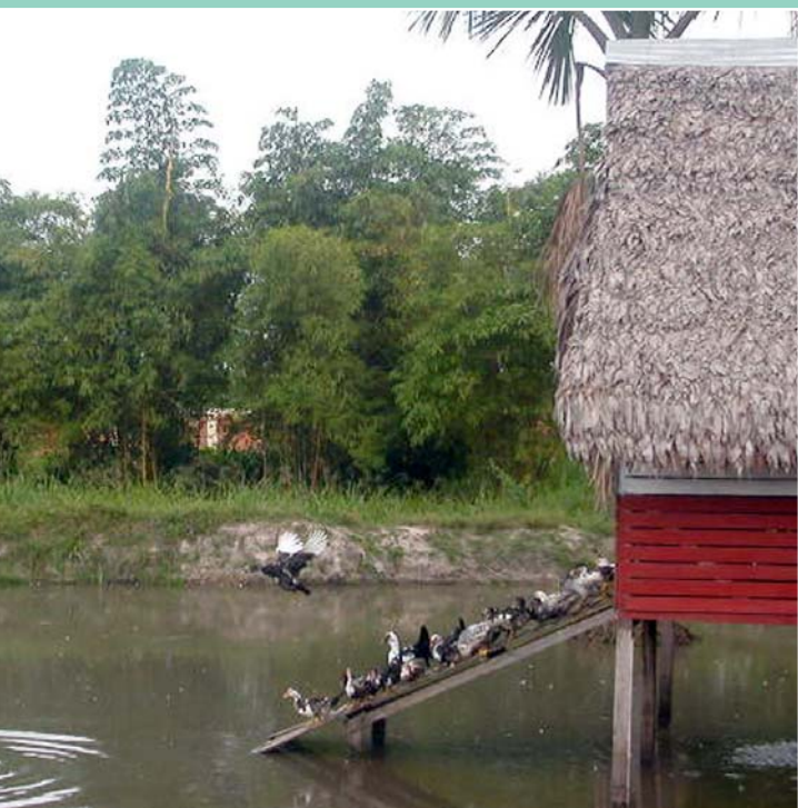
donde también se crían peces. La casa de las aves está construida a un metro de la superficie del agua