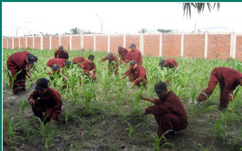
Quitán las malas hierbas de un sembrío de maíz