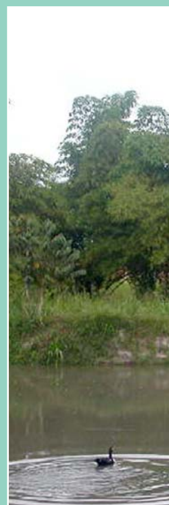
Laguna de los patos,

9 - Vivero ecológico, donde aprenden a explotar la tierra sin producirle daños. Tienen sembríos de tomates, maíz, yuca y camotes. Y por otro lado, aprovechan el bambú que crece en sus 60 mil metros cuadrados para construir galpones para aves y ganado que techan con hirapay y shebón, de hojas impermeables.