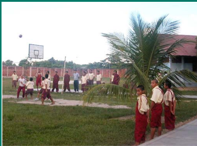
Los chicos se ponen de pie y saludan cortésmente