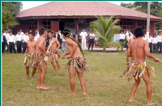
Danza de la Anaconda, en homenaje a su aniversario