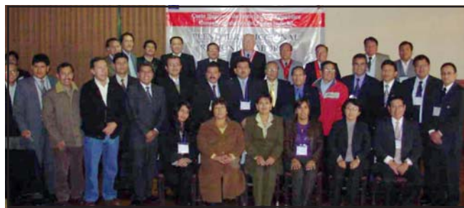
Pleno Jurisdiccional Laboral en Huancayo

El Pleno Jurisdiccional Regional en materia laboral se realizó en la ciudad de Huancayo los días 23 y 24 de Mayo, con participación de magistrados de las Cortes Superiores de Ayacucho, Apurímac, Junín, Huánuco y Huancavelica, quienes adoptaron posiciones uniformes en torno a la retención realizada por el empleador en ejecución de sentencia, el cálculo de intereses