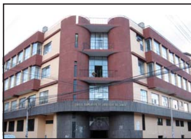
Sede de la Corte Superior de Justicia de Junín en el distrito de El Tambo, Huancayo

Subrayó que en otra ocasión “el presidente de la Región, me ofreció buscar y encontrar un terreno no menor a 10 mil metros cuadrados. Es difícil encontrarlo en Huancayo pero en el distrito de El Tambo puede que logremos encontrarlo”.