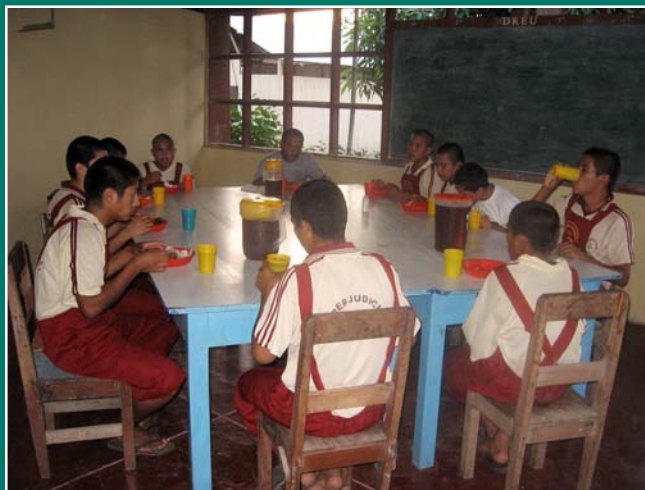
Hora del almuerzo. Los muchachos utilizan los muebles que ellos construyeron con madera producida en el Centro

“El valor agregado que le damos nosotros al Sistema de Reinserción es que a los chicos les hacemos vivir una vida totalmente ecológica, de modo que cuando regresan a su comunidad hacen un efecto multiplicador, para lo cual está perfectamente preparado y así procuramos que su familia, su comunidad, aprenda a vivir ecológicamente como nosotros les enseñamos”, concluye el orgulloso Director.