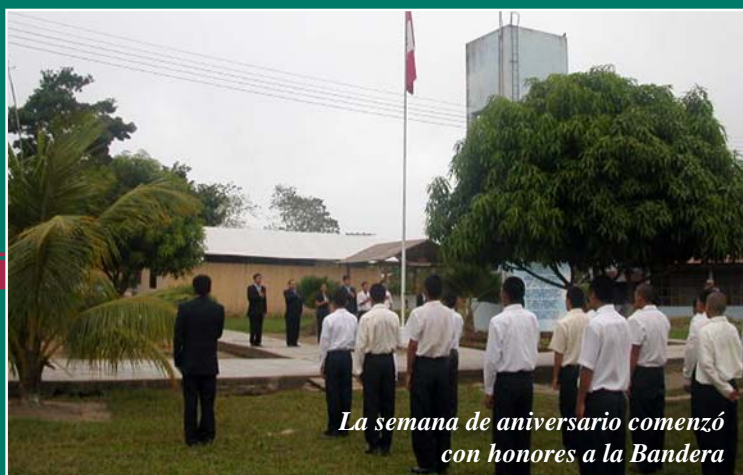
La semana de aniversario comenzó con honores a la Bandera