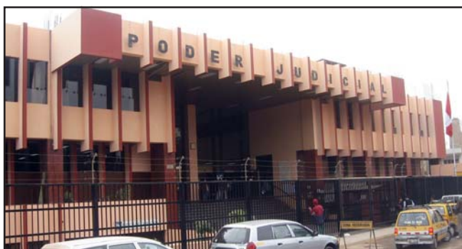
Casa de la Justicia de Ica