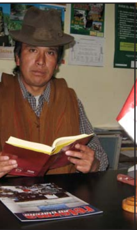
Juez de Primera Nominación de Apata