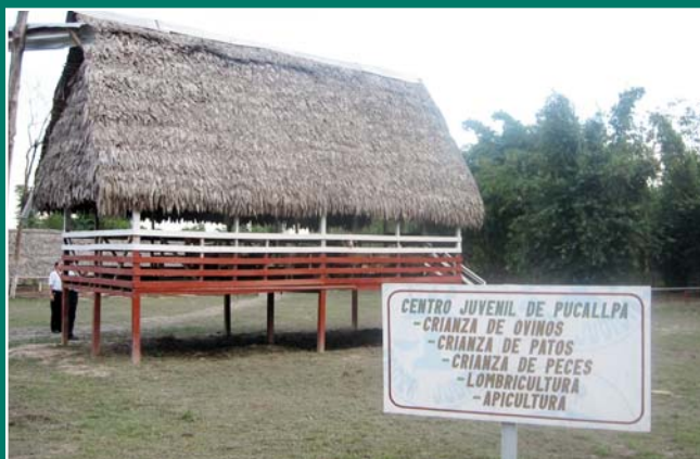
Galpones para el ganado menor que los chicos del Centro de Pucallpa mantienen impecables