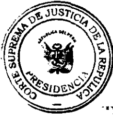
----- Dr. JAVIER VILLA STEIN Presidente del Poder Judicial

Regístrese, comuníquese, publíquese y cúmplase.